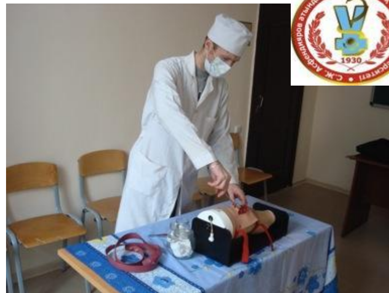
Подготовка к ОСКЭ

Ознакомление с центром практических навыков КазНМУ