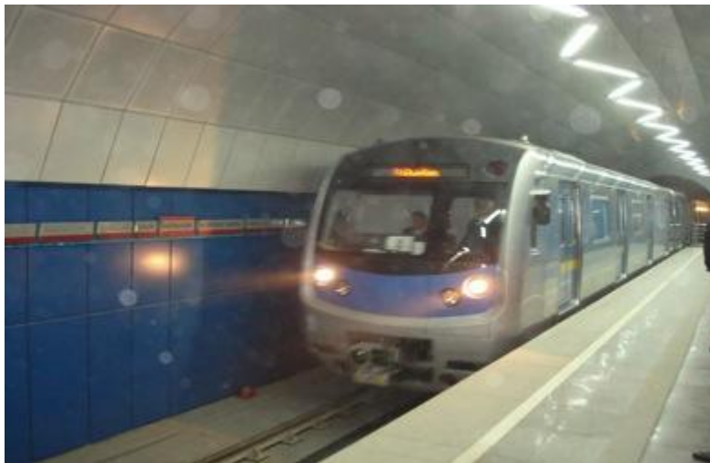
Изучение метрополитена г. Алматы