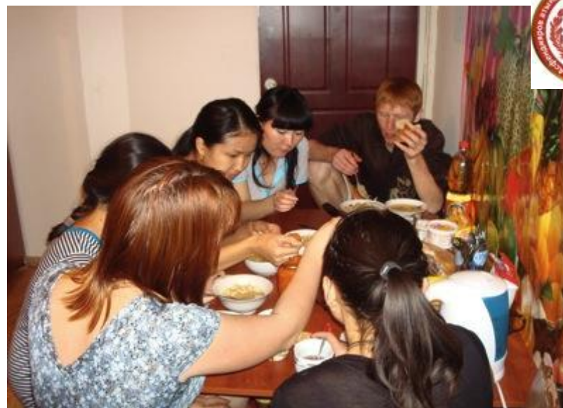
Ужин в нашей общей комнате