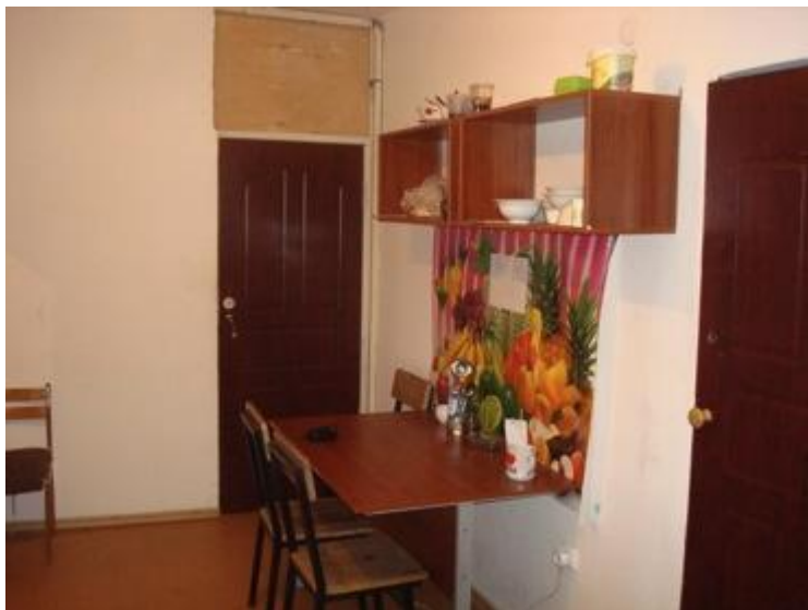
Общая комната № 68