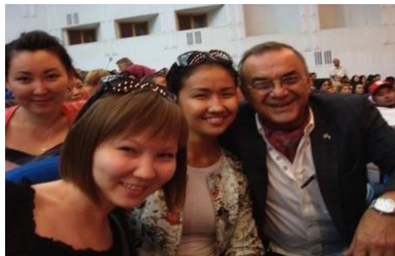
Посещение VII кинофестиваля «Евразия», Алматы, 18-24 сентября