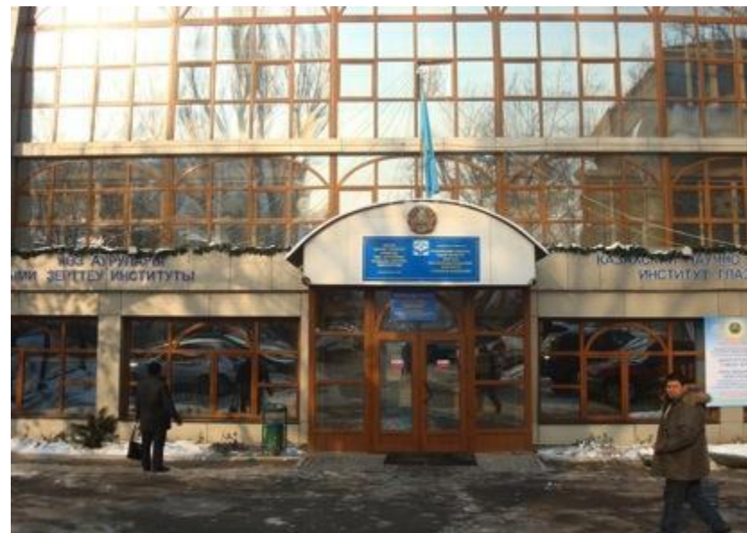
Казахский научно-исследовательский институт глазных болезней