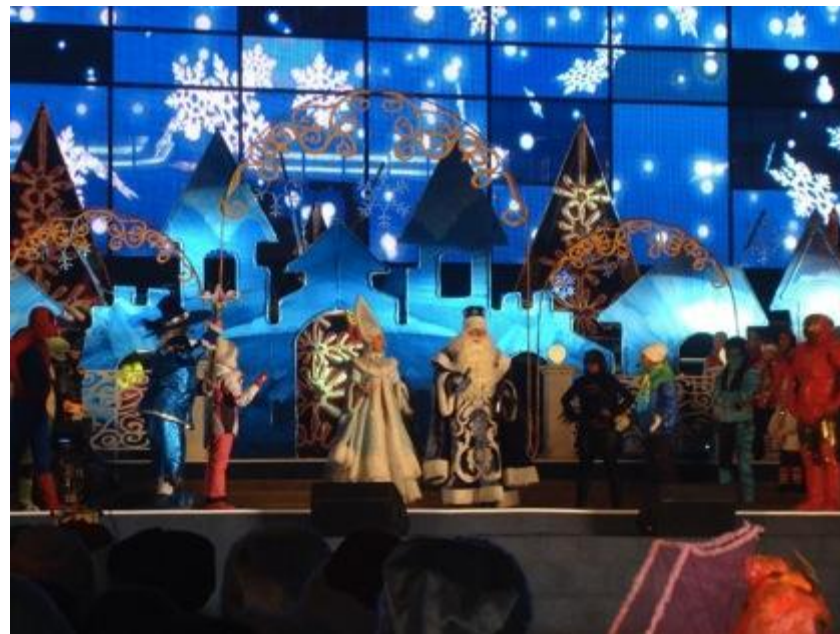
Зажжение главной новогодней елки г. Алматы