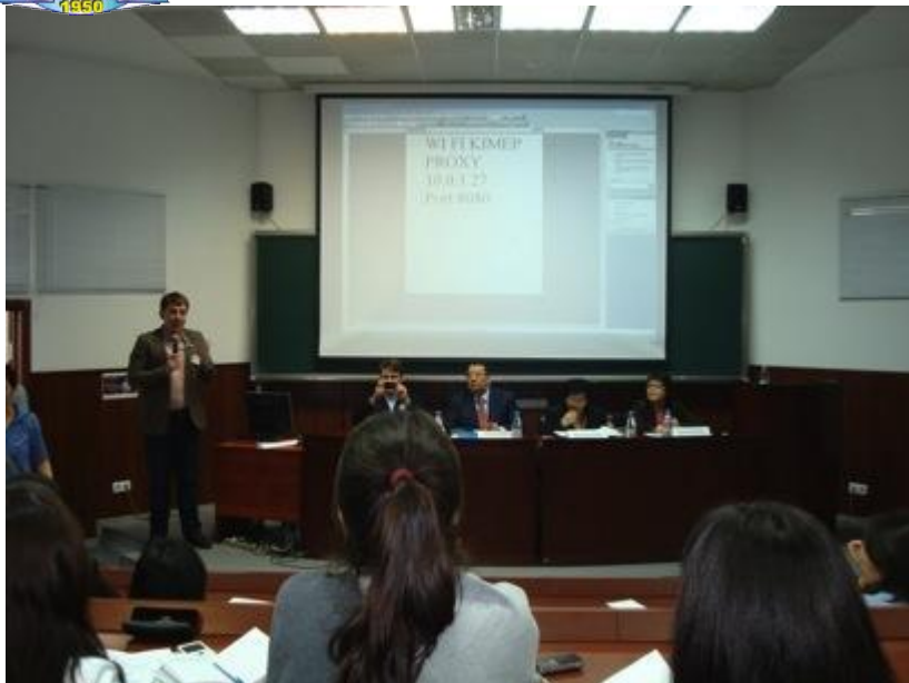
Участие в форуме « Молодых предпринимателей »