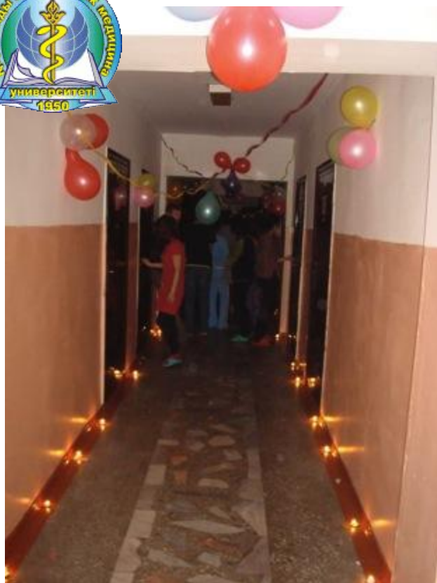
«Праздник свечей в нашем общежитии»