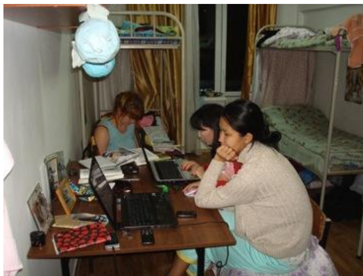
Усиленная подготовка к парам, хирургические болезни