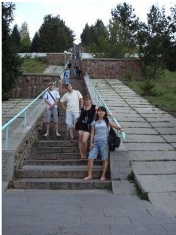
Пробуем свои силы на «лестнице здоровья»