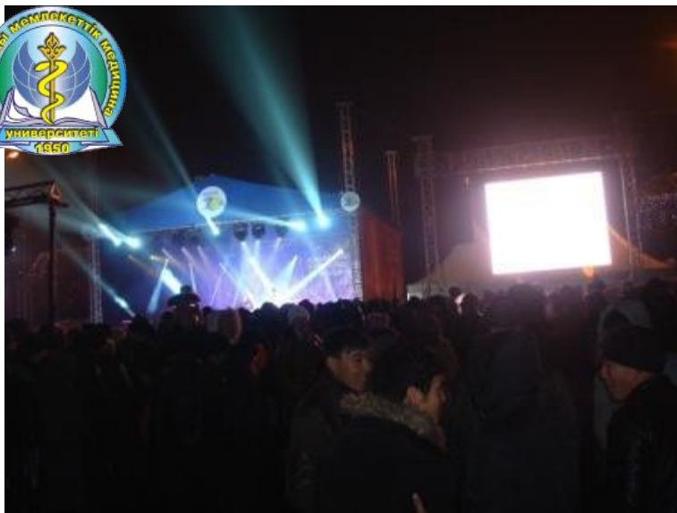
Концерт на старой площади «Астана», посвященный 20-летия независимости РК