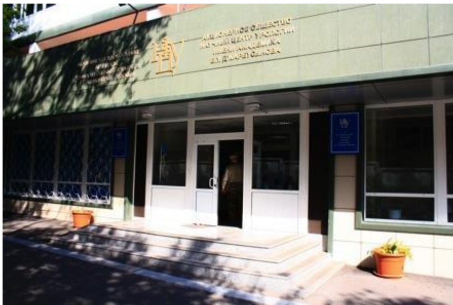
НЦУ им. Б.У. Джарбусынова