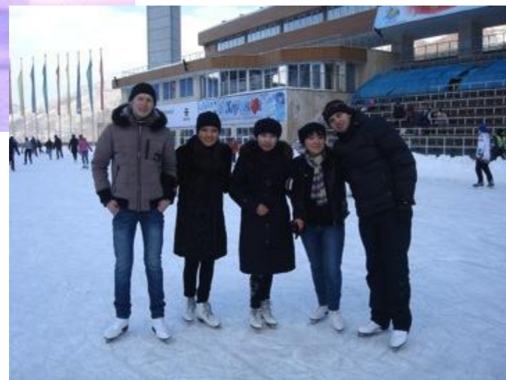
«Мы на МЕДЕУ»