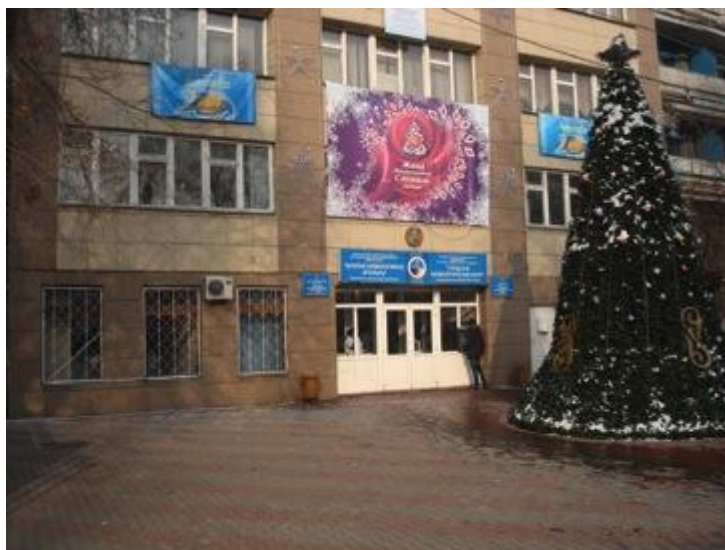
Городской кардиологический центр