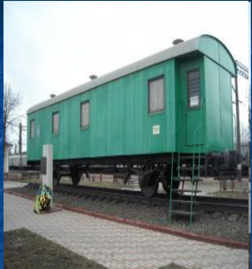
"Музей на колесах", город Фастов