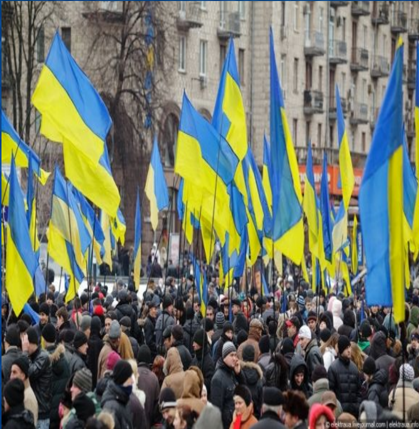
День празднования Соборности Украины в 2011г.