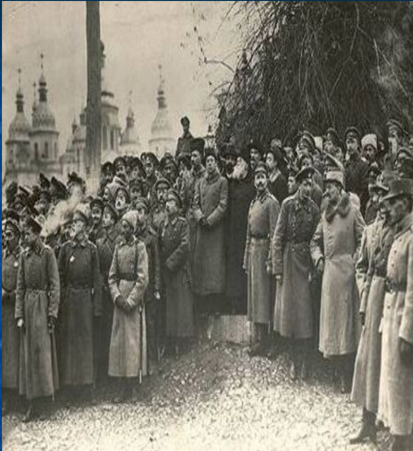
Киев 22 января 1919-го. Все та же Софийская площадь и древний Софийский собор.