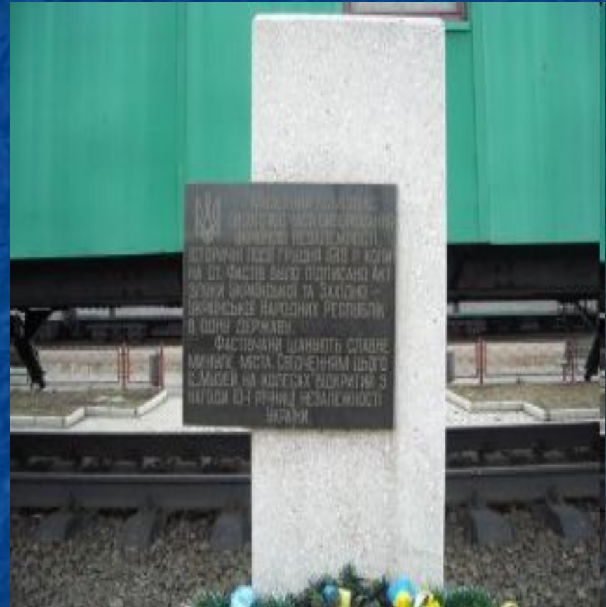
"Музей на колесах", город Фастов.