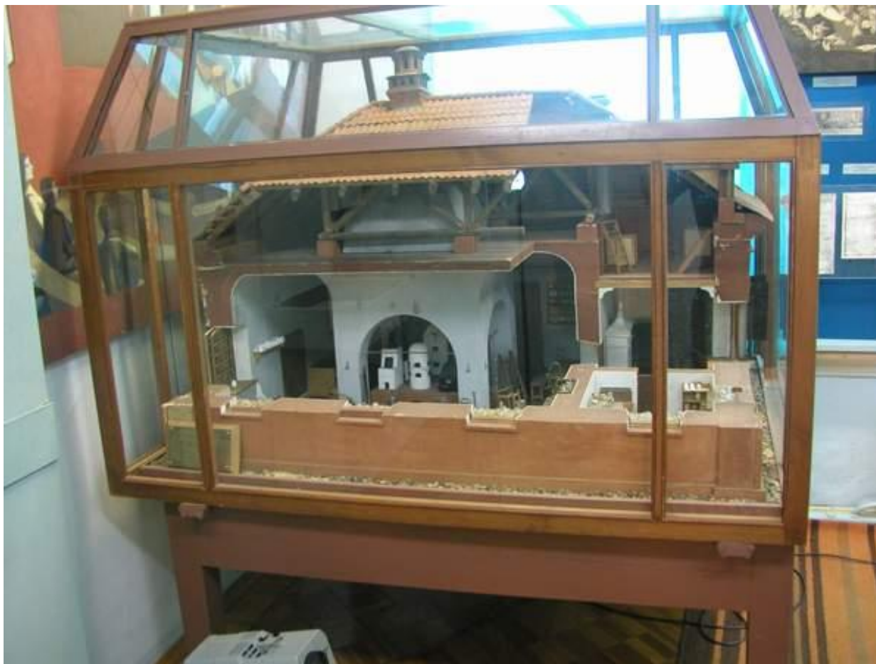
Макет химической лаборатории Ломоносова.