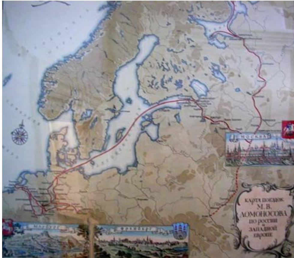
Карта поездок Ломоносова по России и западной Европе.