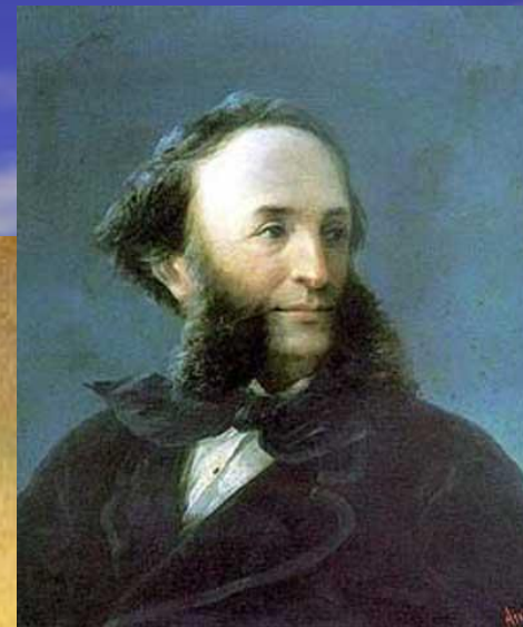
И. К. Айвазовский.