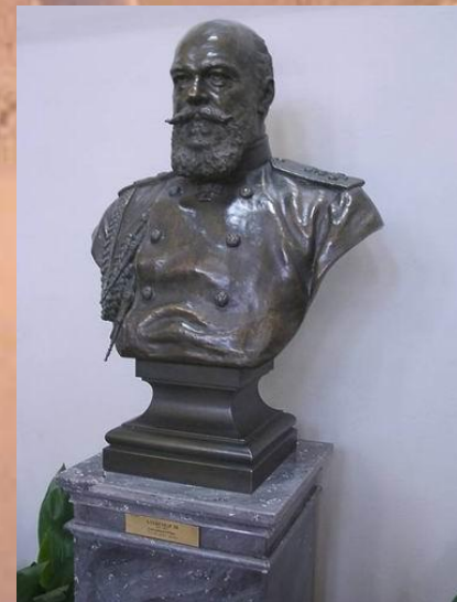
Бюст Александра III

Как тут идет большая лестница, которая расходится в разные стороны. Сверху от лестницы изображена табличка, на которой написано «Русский музей императора Александра третьего», а под таблицей стоит бюст императора Александра III