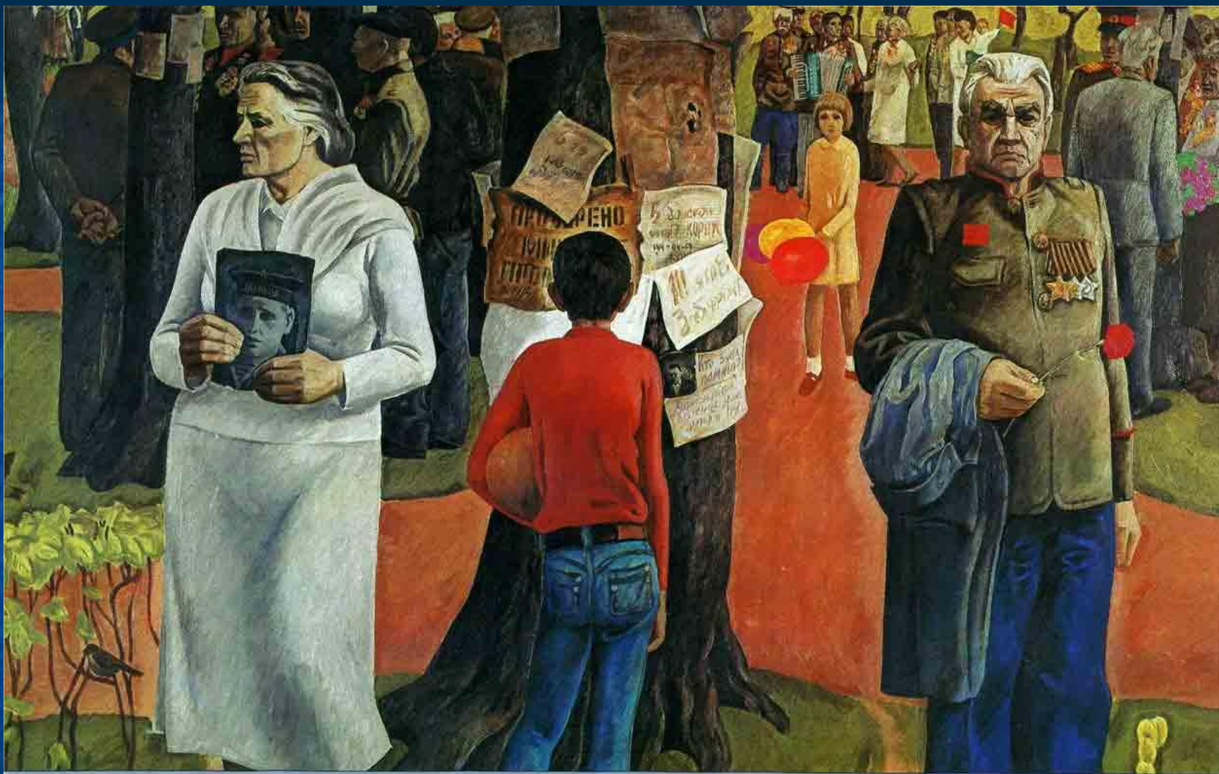
В. Парев. Память 9-го мая