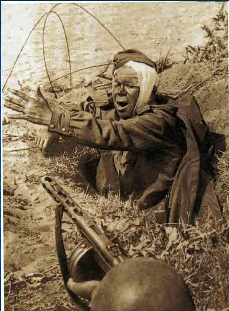
Политрук продолжает бой. 1944.