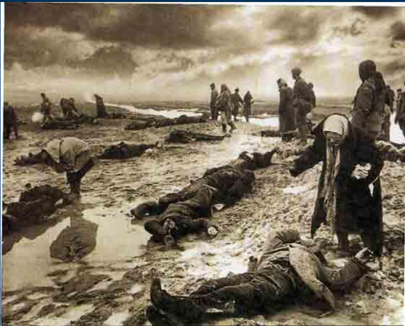
Горе. 1942.