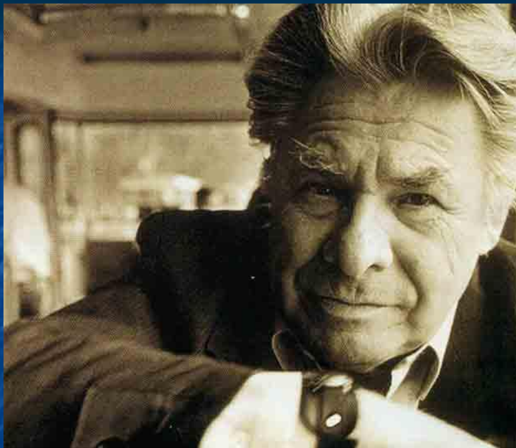
Носов Евгений Иванович 1925 - 2002