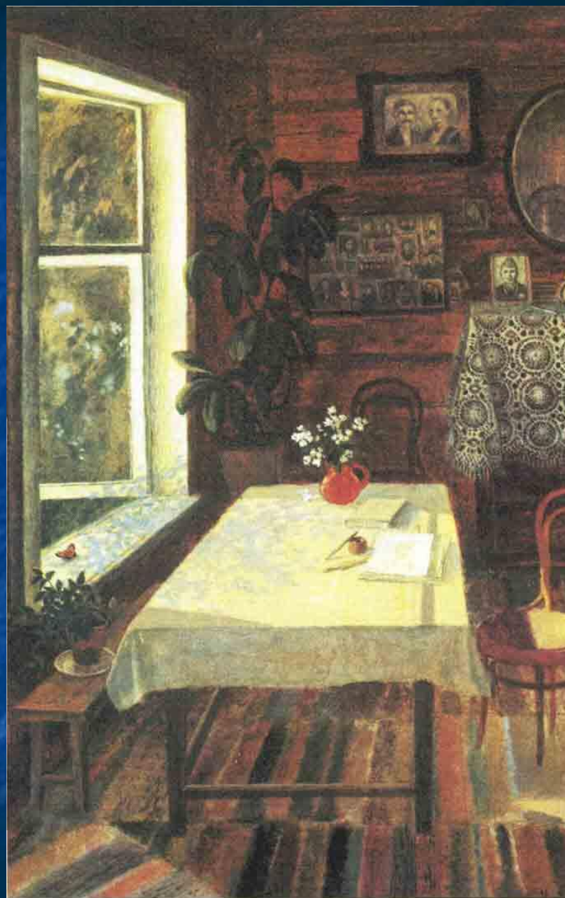
С.Бордюга. Иллюстрация к рассказу «Живое пламя»