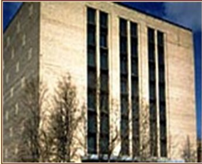
Центральный исторический архив Москва