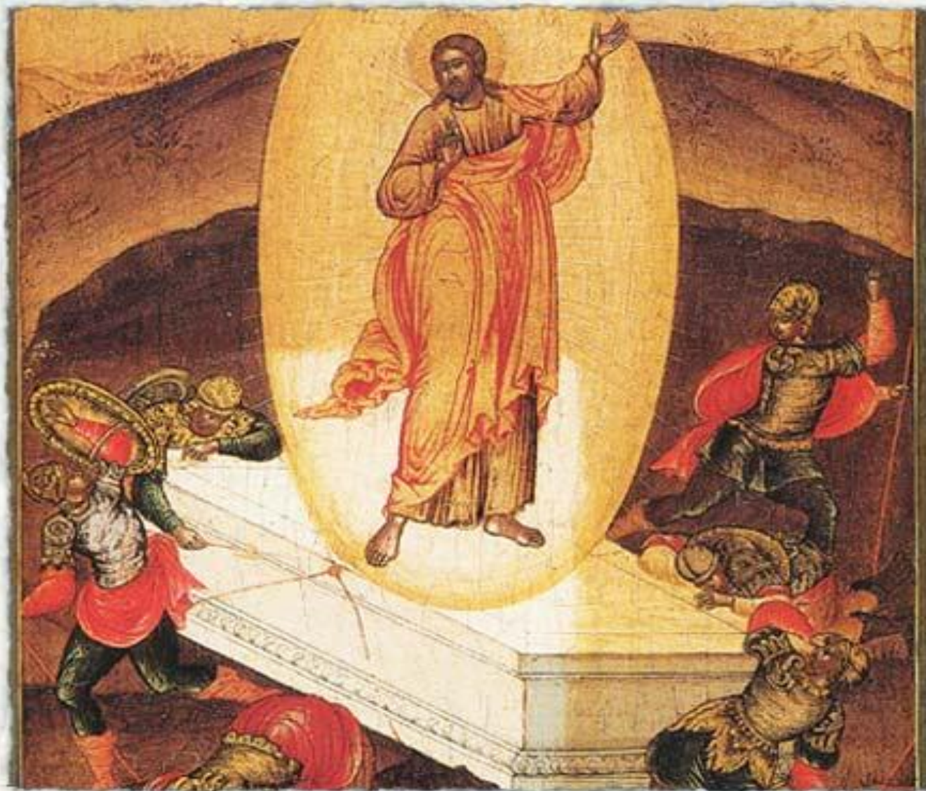
XVIII в. Воскресение Христово. Деревою., темпера. 31,1 x 26,5 x 2. Русский музей, Петербург. Реставрация мастерской И. Чурикова, XIX в.