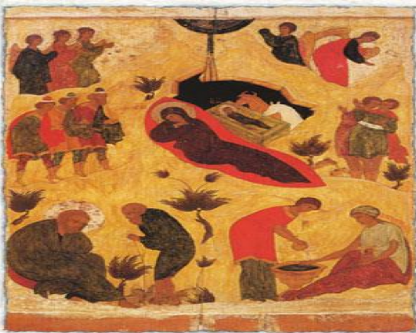
Нач. XVI в., Москва. Рождество Христово., Дерево, темпера. 77 x 59 x 2,9. Русский музей, Петербург.