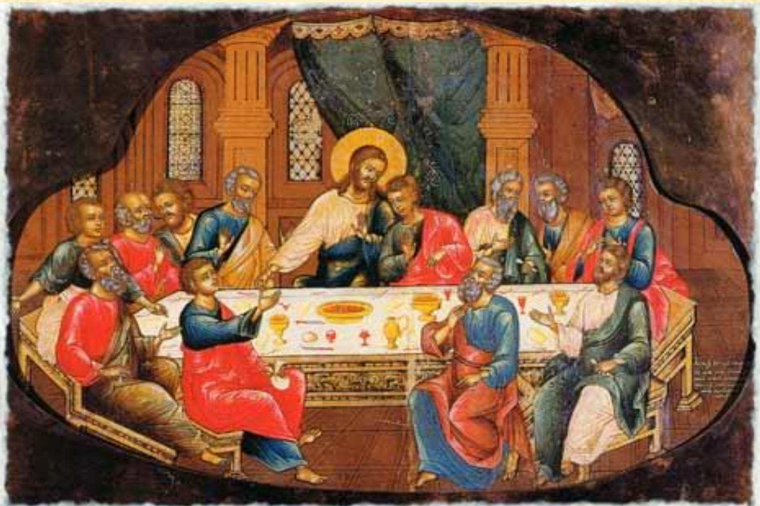
1695 г. Иван Ушаков Михайлов. Тайная вечеря. Дерево, темпера, металлическое обрамление. 61,5x48,5. Русский музей. Оп.: Исус Христос. СПб., 2000. С. 190.