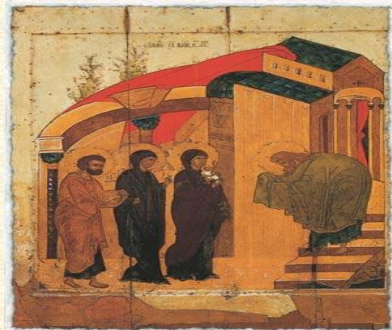
Ок. 1450 г. Сретение. Тверь. Дерево, левкас, темпера. 103x82x3. Преображенский собор Твери. Ныне в Русском музее.