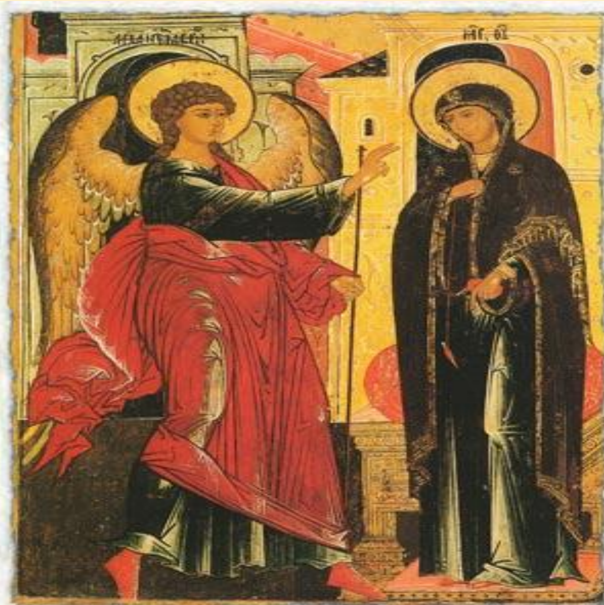
Первая треть XVIII в. Благовещение. Ярославль. Дерево, темпера. 195 x 115 x 4. Русский музей, Петербург.