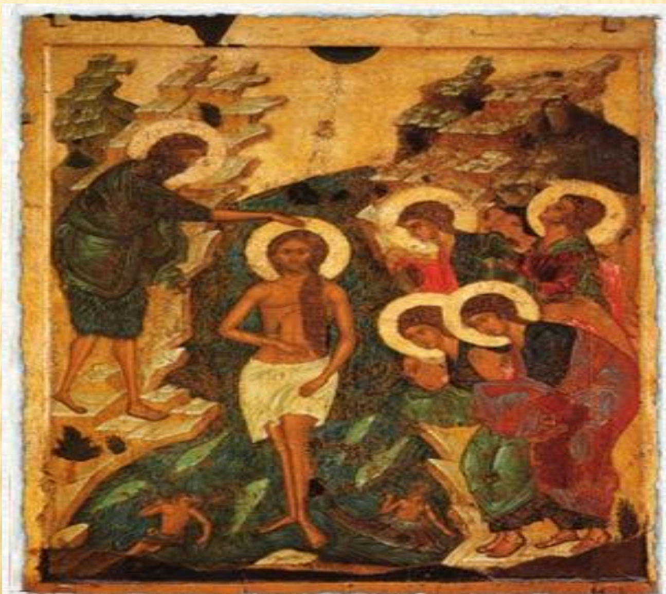
Ок. 1408 г. Андрей Рублев, Даниил Черный. Крещение Господне. Дерево, темпера. 124x93x3. Русский музей, Петербург (из Успенского Владимирского собора).