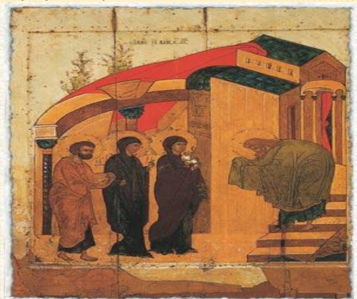
Ок. 1450 г. Сретение. Тверь. Дерево, левкас, темпера. 103x82x3. Преображенский собор Твери. Ныне в Русском музее.