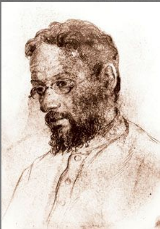
Рисунок художника Д. И. Иванова Соловецкий лагерь 1935 год

П.А. Флоренский был репрессирован в 1933 году. Расстрелян в 1937 году на Соловках.