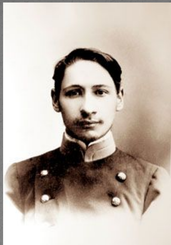
П. А. Флоренский – студент Московского университета 1904 год