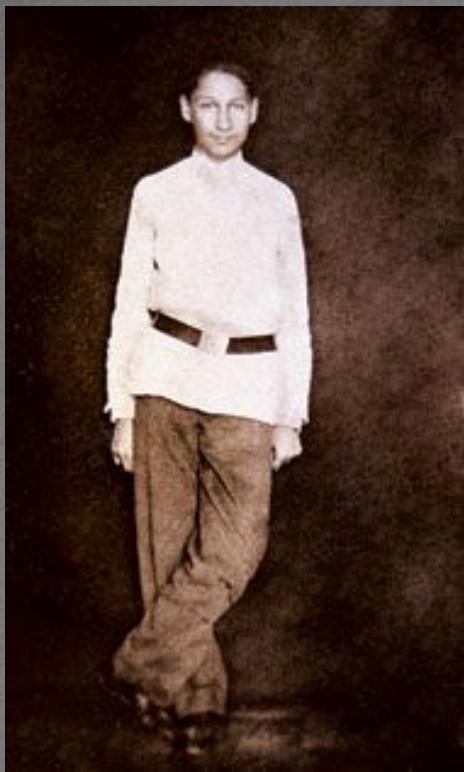
Павел Флоренский – гимназист Около 1898 года