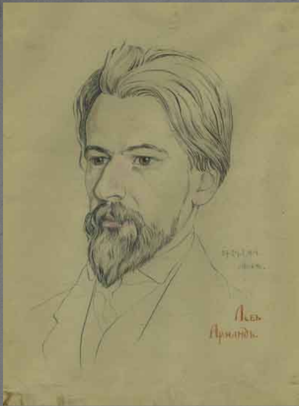
Портрет С.С. Троицкого 1907.