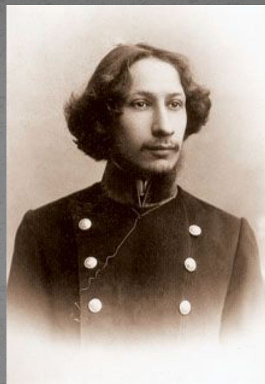
П. А. Флоренский – студент Московской Духовной академии 1908 год