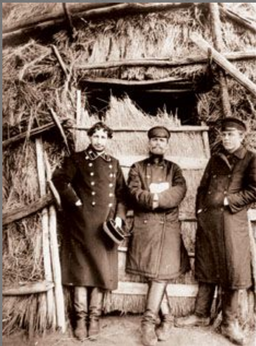
Павел Флоренский в селе Толпыгино около 1906 года. (рядом жители с. Толпыгино)