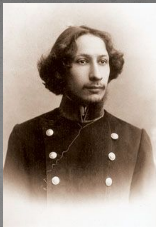
П. А. Флоренский – студент Московской Духовной академии 1908 год