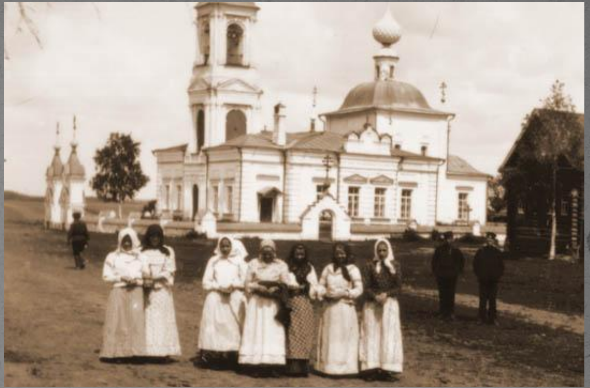
Храм Воскресения Христово в с. Толпыгино 1909г.