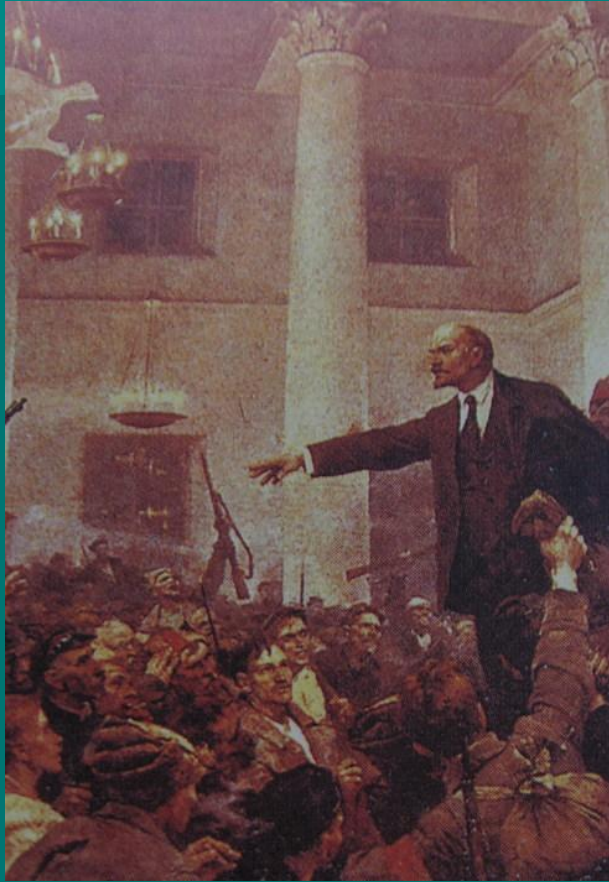
Лидер большевиков Владимир Ильич Ленин.

2 марта 1917 года, подписав манифест об отречении от престола в пользу своего брата Михаила Александровича, Николай II отправился в Могилев, чтобы попрощаться с армией. В дороге не было никаких инцидентов, внешне Николай Александрович был совершенно спокоен. По прибытию в Могилев ему сообщили, что брат Михаил отрекся от прав на престол (в конце концов, власть перешла в руки большевиков).