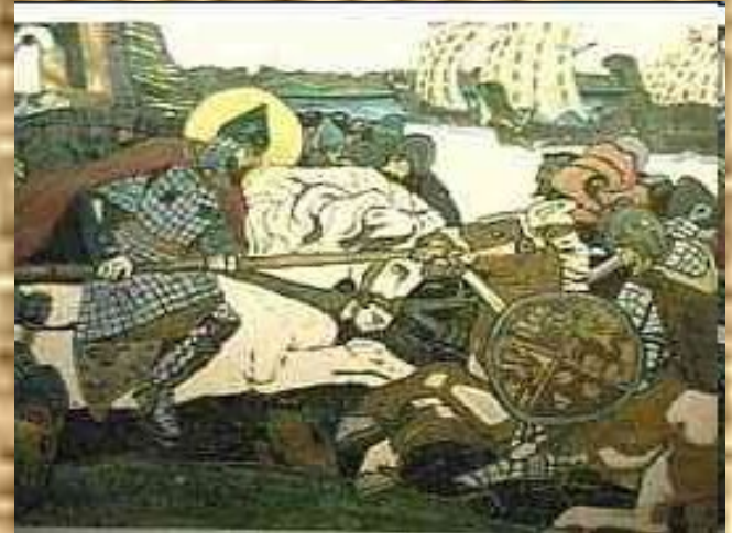
"Бой Александра Невского с ярлом Биргером" (картина Н. К. Рериха)

Всеобщую славу молодому князю принесла эта победа, одержанная им на берегу Невы, в устье реки Ижоры 15 июля 1240 года над шведским отрядом, которым командовал будущий правитель Швеции и основатель Стокгольма, ярл Биргер (однако в шведской Хронике Эрика XIV века о жизни Биргера этот поход вообще не упоминается). Считается, что именно за эту победу князя стали называть Невским, но впервые это прозвище встречается в источниках только с XIV века.