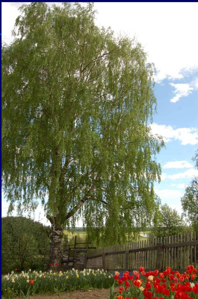
Береза у дома семьи Чинкиных