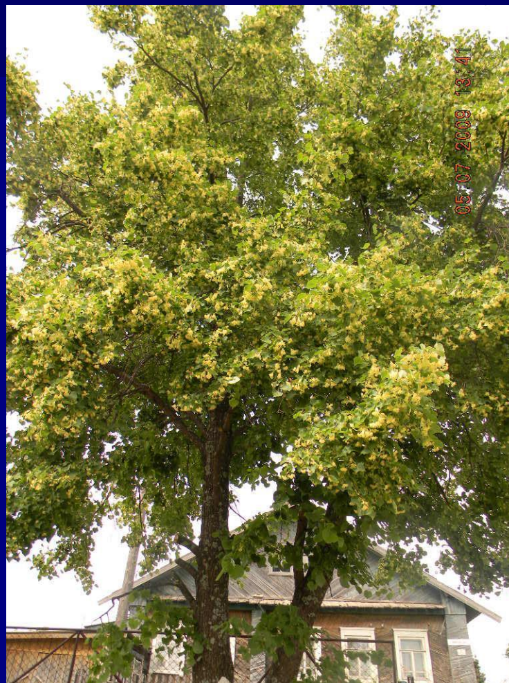
Липа у дома семьи Латышевых