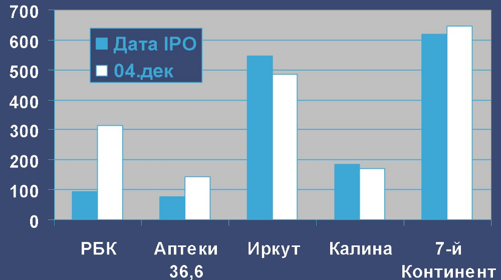
Рыночная капитализация (млн. долл. США)