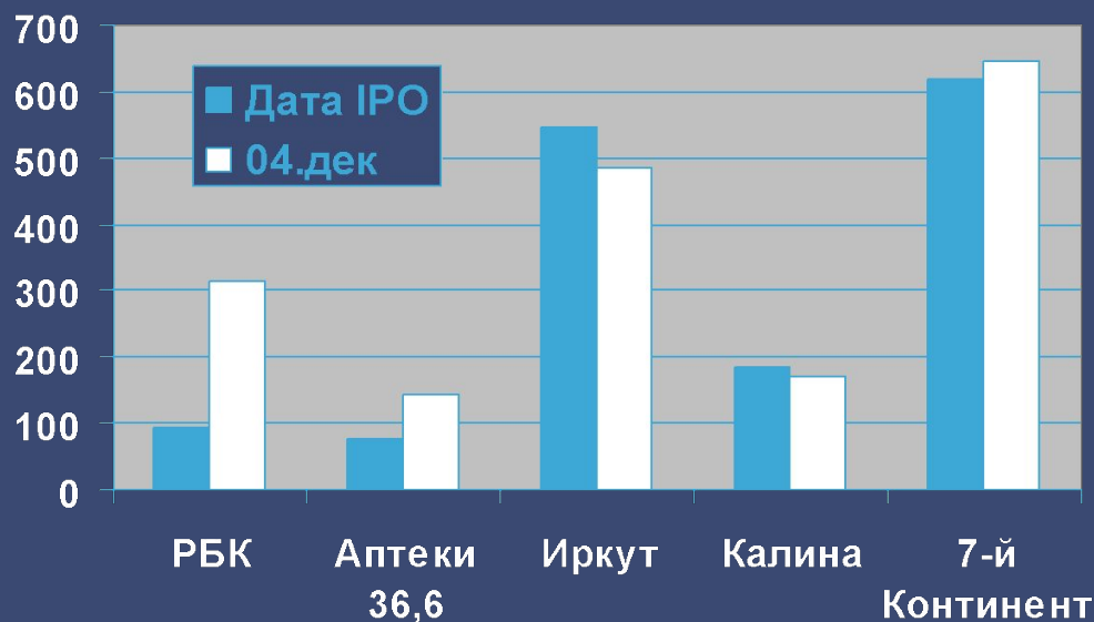
Рыночная капитализация (млн. долл. США)