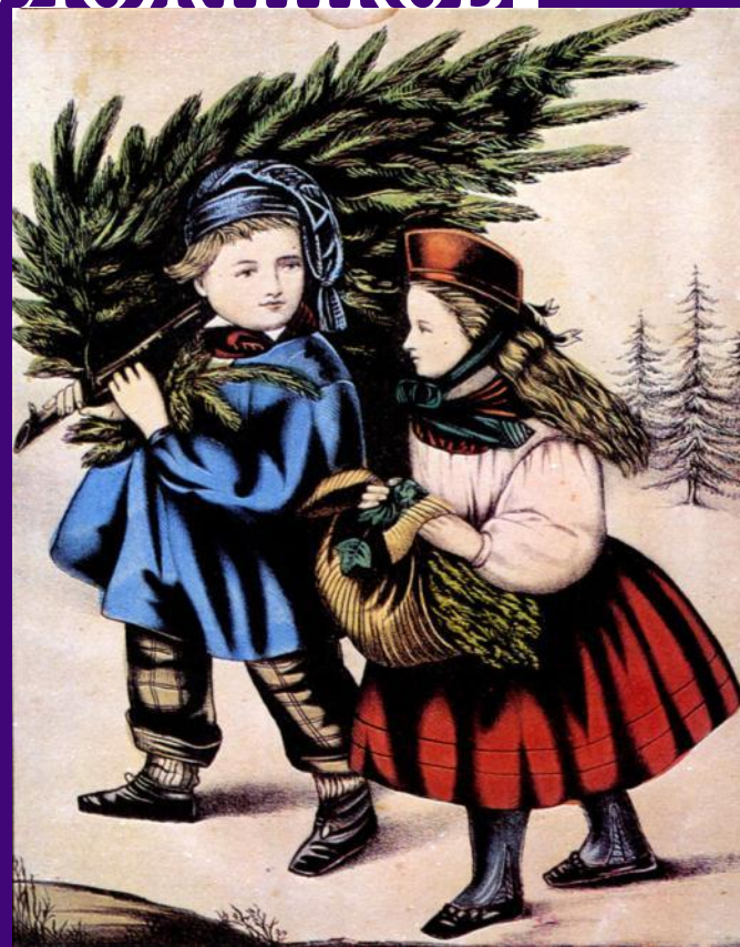
Дети с елкой.