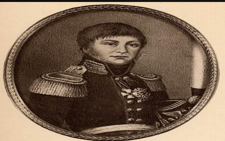
Александръ Самойловичъ Фигнеръ, 1787 — 1813