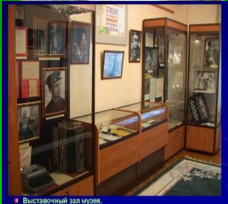
■ Выставочный зал музея.