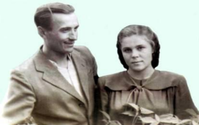
С солисткой Волжского русского народного хора. 1955 г.