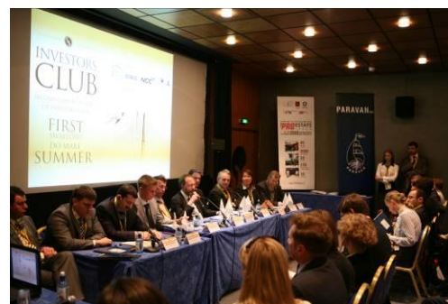
Investors' Club в рамках MIPIM 2010