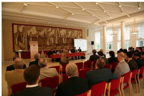
Боннская сессия (2009)