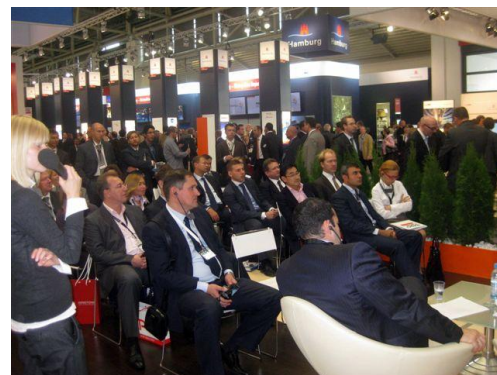
Мюнхенская сессия (2009)