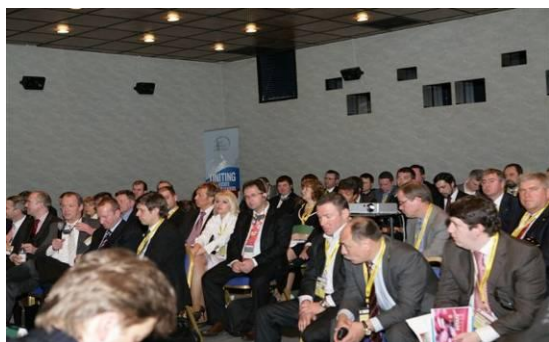
Investors' Club в рамках MIPIM 2009