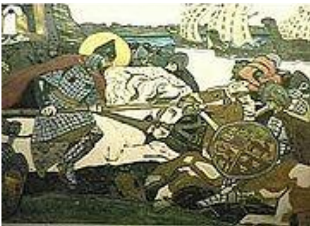
«Бой Александра Невского с ярлом Биргером» (картина Н. К. Рериха)

С сравнительно небольшой дружиной новгородцев и ладожан Александр ночью 15 июля 1240 года врасплох напал на шведов Биргера, когда они при устье Ижоры, на Неве, остановились лагерем для отдыха, и нанёс им полное поражение — Невская битва. Сам сражаясь в первых рядах, Александр «неверному кралю их (Биргеру) возложил остриём меча печать на челе» . Победа в этой битве продемонстрировала талант и силу Александра.