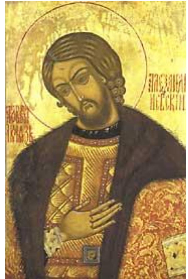
Икона святого благоверного князя Александра Невского

Частица мощей святого благоверного князя Александра Невского находится в Храме Александра Невского в городе София, Болгария. Также часть мощей (мизинец) Александра Невского находится в Успенском соборе города Владимира. Мощи были переданы указом Святейшего Патриарха Московского и всея Руси Алексия II в октябре 1998 года в канун празднования 50-летия открытия подворья Болгарской Православной Церкви в Москве.