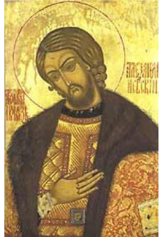
Икона святого благоверного князя Александра Невского

Частица мощей святого благоверного князя Александра Невского находится в Храме Александра Невского в городе София, Болгария. Также часть мощей (мизинец) Александра Невского находится в Успенском соборе города Владимира. Мощи были переданы указом Святейшего Патриарха Московского и всея Руси Алексия II в октябре 1998 года в канун празднования 50-летия открытия подворья Болгарской Православной Церкви в Москве.