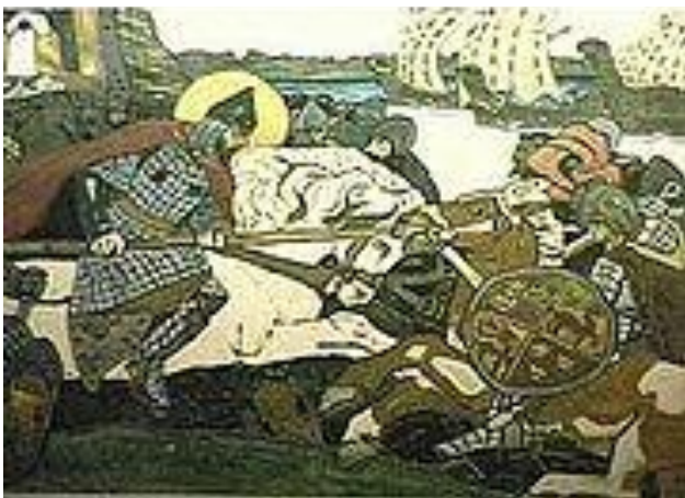
«Бой Александра Невского с ярлом Биргером» (картина Н. К. Рериха)

С сравнительно небольшой дружиной новгородцев и ладожан Александр ночью 15 июля 1240 года врасплох напал на шведов Биргера, когда они при устье Ижоры, на Неве, остановились лагерем для отдыха, и нанёс им полное поражение — Невская битва. Сам сражаясь в первых рядах, Александр «неверному кралю их (Биргеру) возложил остриём меча печать на челе» . Победа в этой битве продемонстрировала талант и силу Александра.