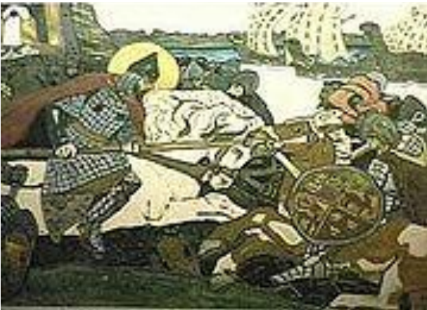
«Бой Александра Невского с ярлом Биргером» (картина Н. К. Рериха)

С сравнительно небольшой дружиной новгородцев и ладожан Александр ночью 15 июля 1240 года врасплох напал на шведов Биргера, когда они при устье Ижоры, на Неве, остановились лагерем для отдыха, и нанёс им полное поражение — Невская битва. Сам сражаясь в первых рядах, Александр «неверному кралю их (Биргеру) возложил остриём меча печать на челе» . Победа в этой битве продемонстрировала талант и силу Александра.