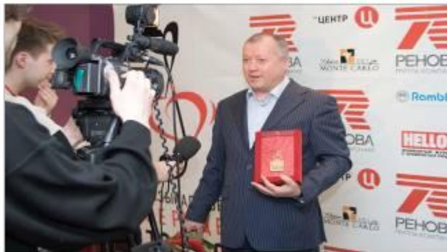
Баннеры в зоне проведения пресс-вечера