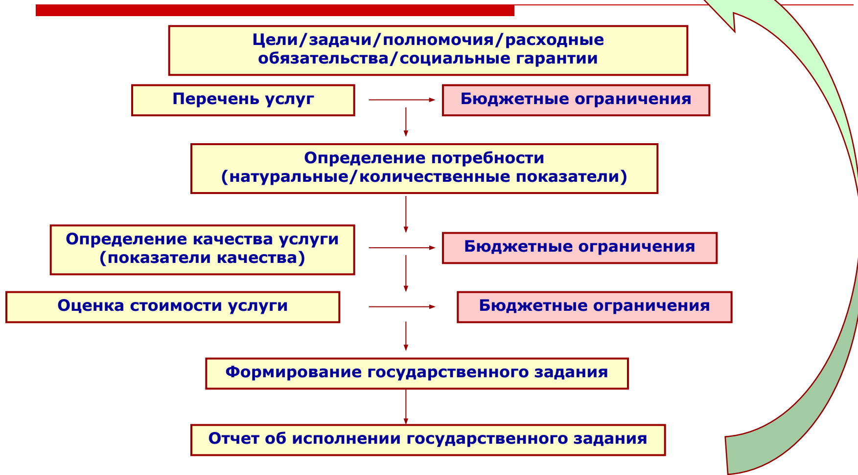
Схема бюджетного процесса