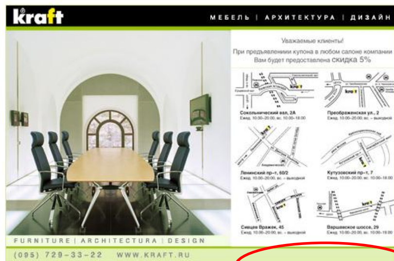
Купон на скидку в магазине компании Kraft

Значение вручную фиксируется менеджерами в системе статистики сайта для анализа финансовой эффективности рекламных кампаний .