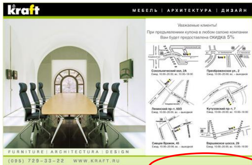
Купон на скидку в магазине компании Kraft

Значение вручную фиксируется менеджерами в системе статистики сайта для анализа финансовой эффективности рекламных кампаний.