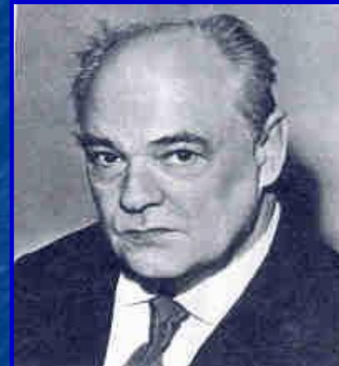
Виталий Валентинович Бианки