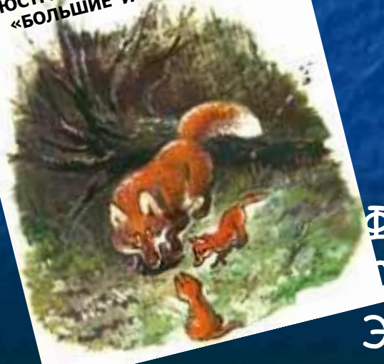
ИЛЛЮСТРАЦИЯ К КНИГЕ Е. ЧАРУШИНА «БОЛЬШИЕ И МАЛЕНЬКИЕ»