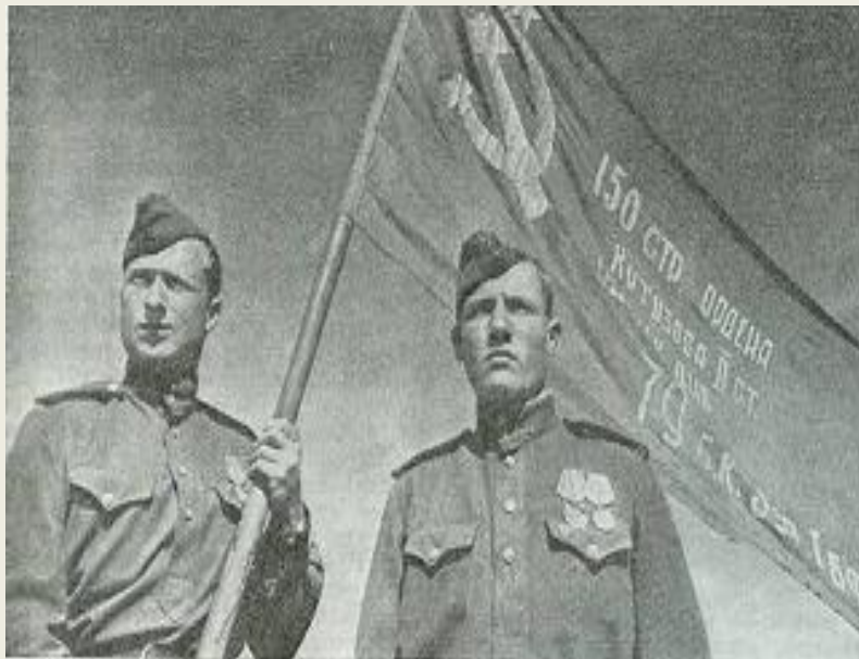
Воиники 736-го полка 150-й стрелковой дивизии М. А. Егоров (справа) и М. В. Кантария со Знаменем Победы, Берлин, Май 1945,