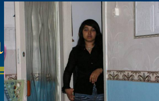
Автор – Сулейманова Г.