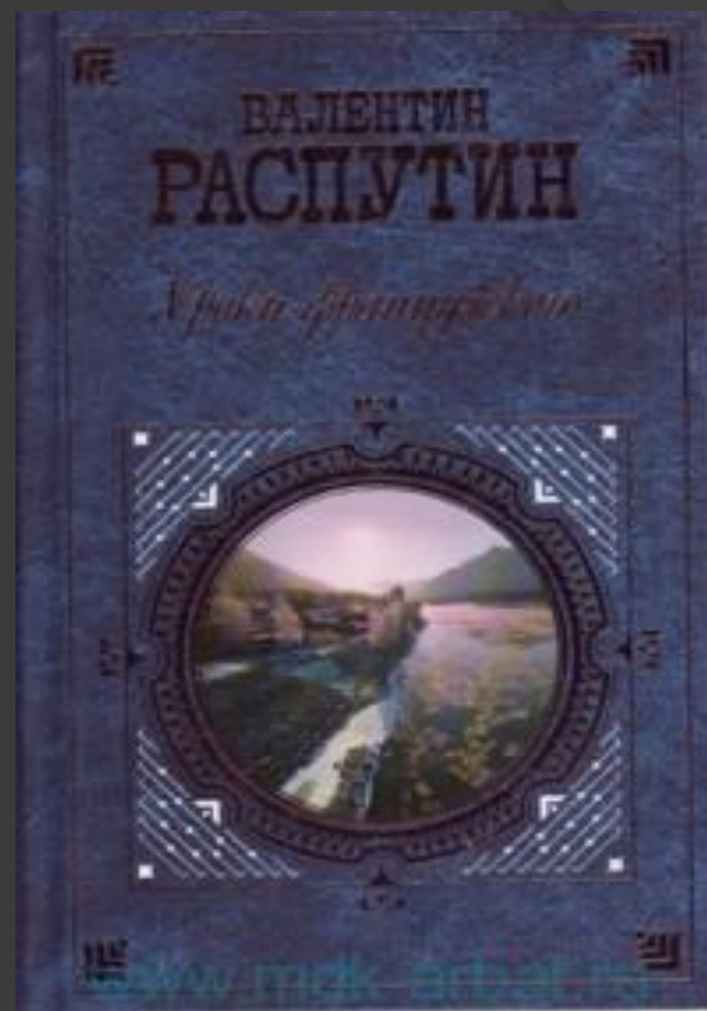
Распутин, Валентин Григорьевич