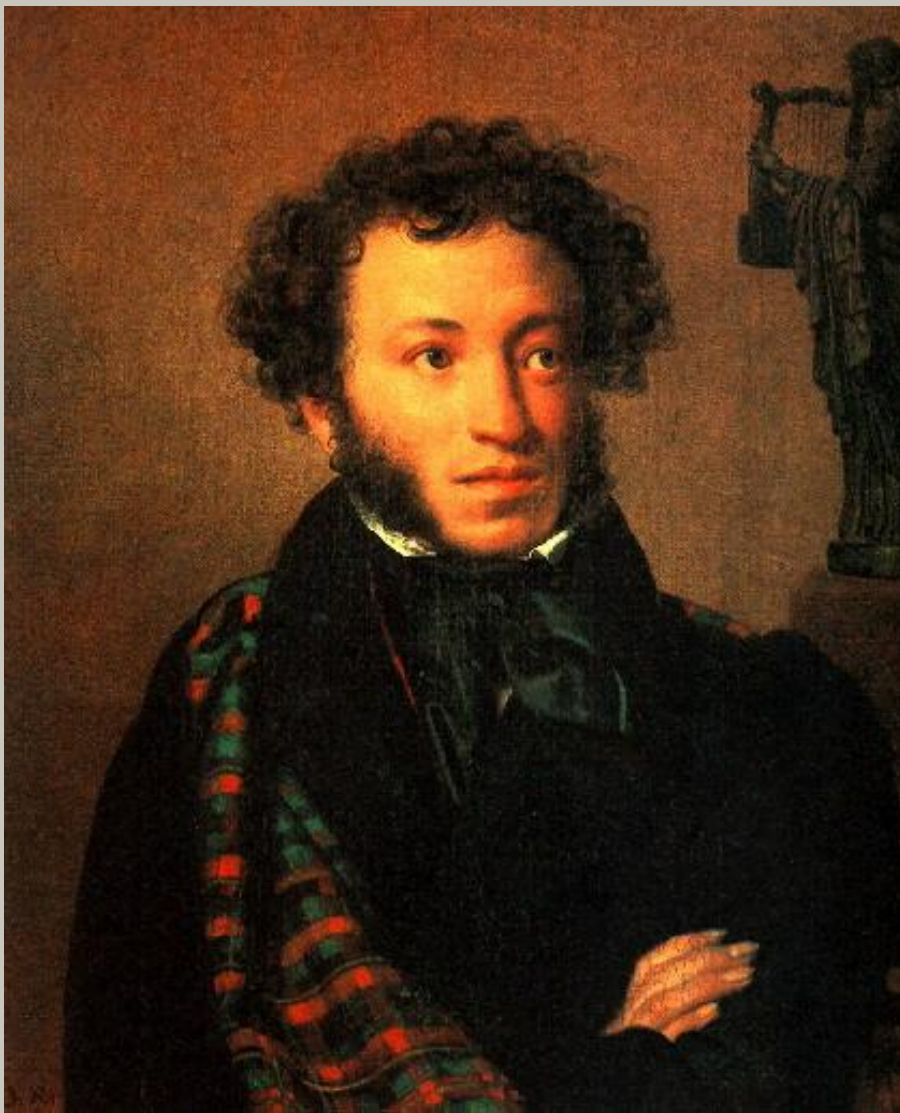
Пушкин Александр Сергеевич