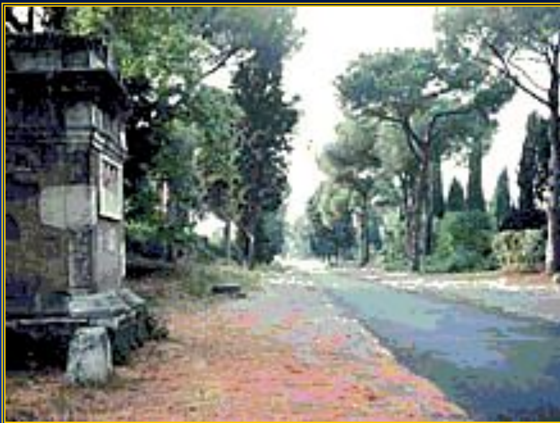
■ Аппиева дорога.