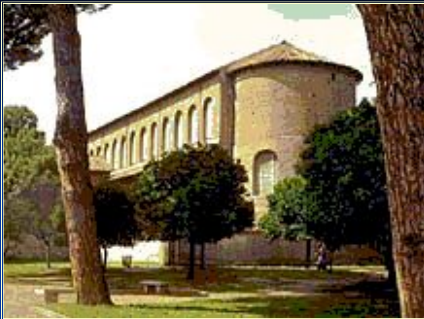
■ Церковь Санта-Сабина.