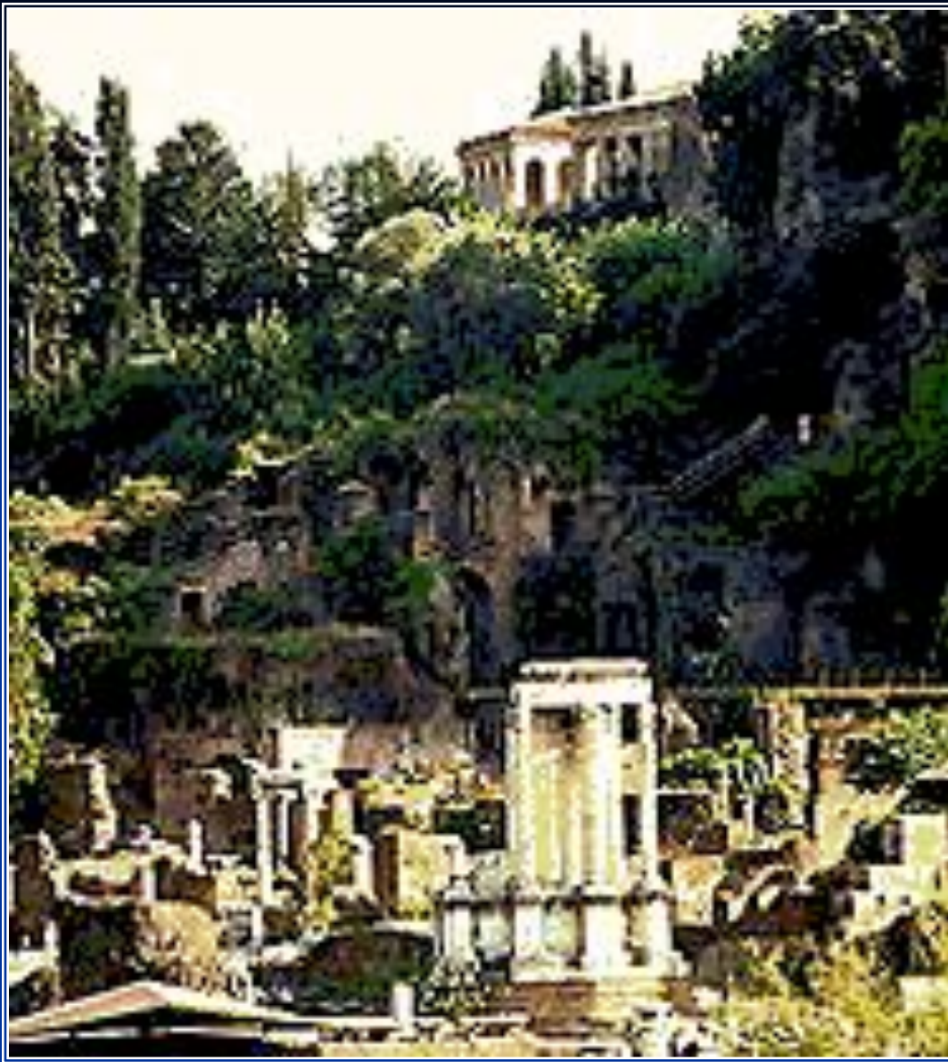
Палатинский холм. Форум Романум.