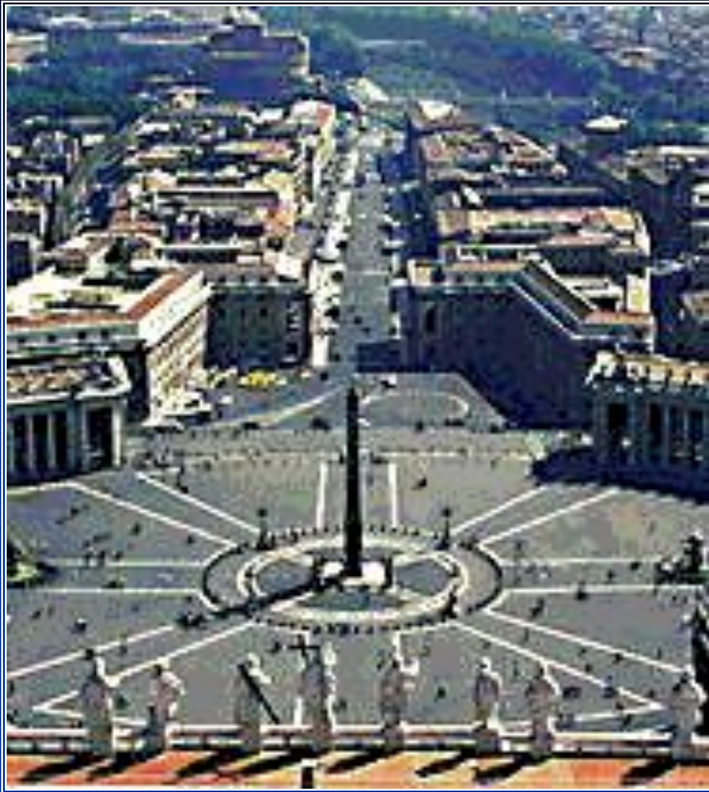
■ Площадь перед собором Св. Петра.