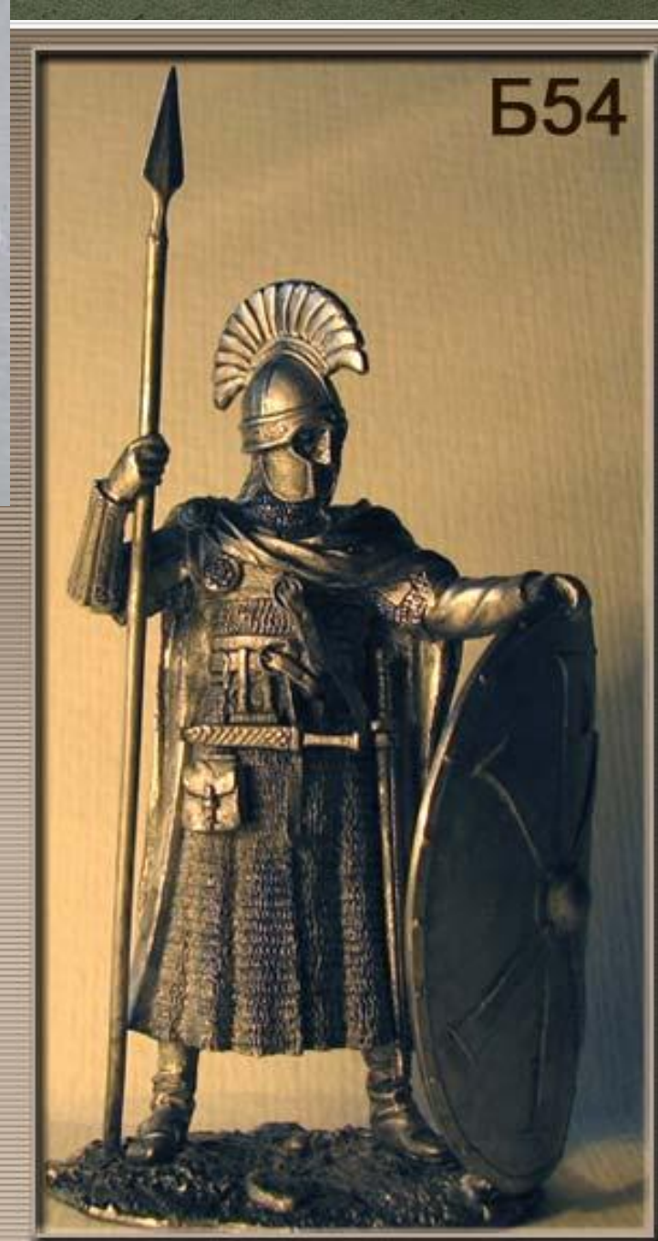
Древний Рим.Легионер - 4-6 вв.н.э.