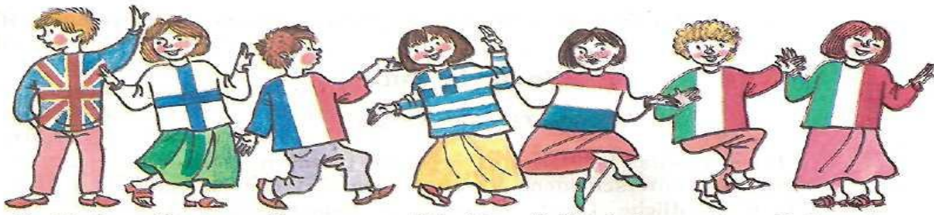
Engländer Finnin Franzose Griechin Holländerin Ire Italienerin