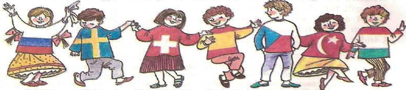
Russin Schwede Schweizerin Spanier Tscheche Türkin Ungar