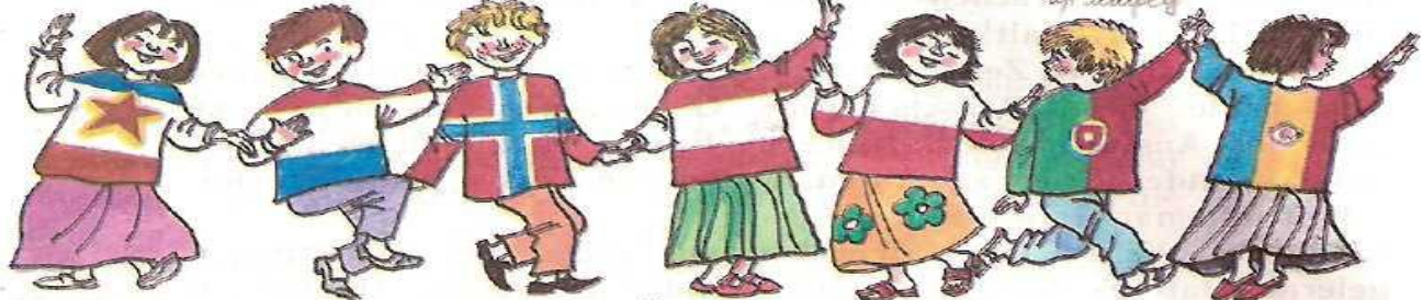
Jugoslawin Luxemburger Norwege Österreicherin Polin Portugiese Rumänin