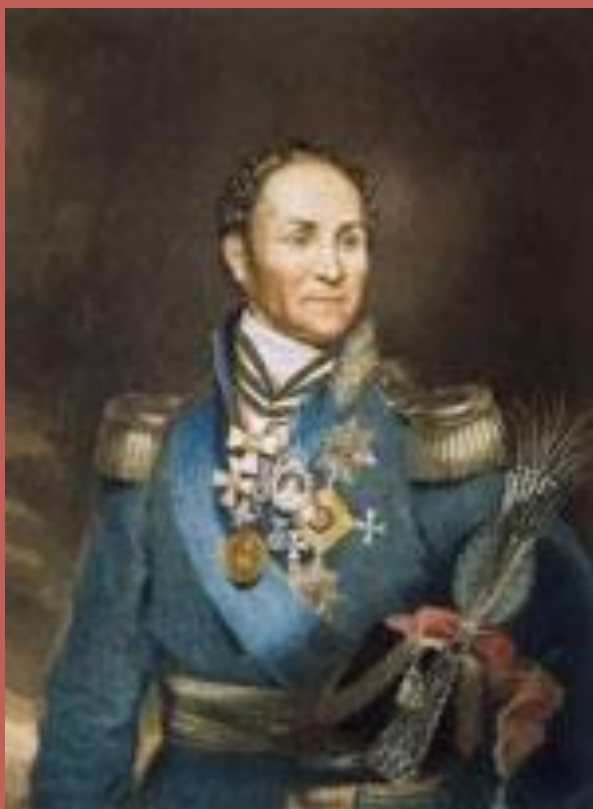
Матвей Иванович Платов

- Мне, ваше величество, (н...)чего для себя не надо, так как я ем-пью что хочу и всем доволен, а я, - говорит, - пришёл доложить насчёт этой нимфозории.