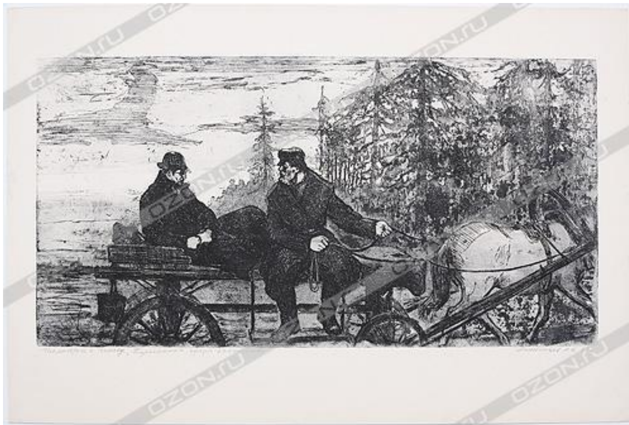
Иллюстрация к рассказу А. П. Чехов "Пересолил". Офорт (1965 год), СССР