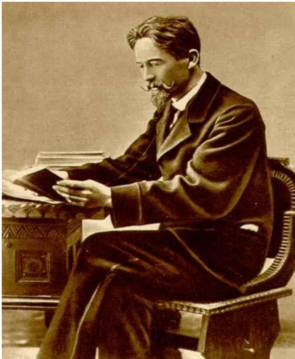
А.П. Чехов. Фотография 1890-х годов.