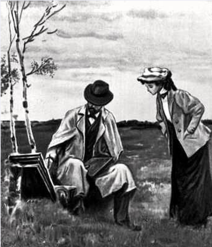
А. П. Чехов. «Дядя Ваня». Сцена из спектакля. МХТ. 1899.