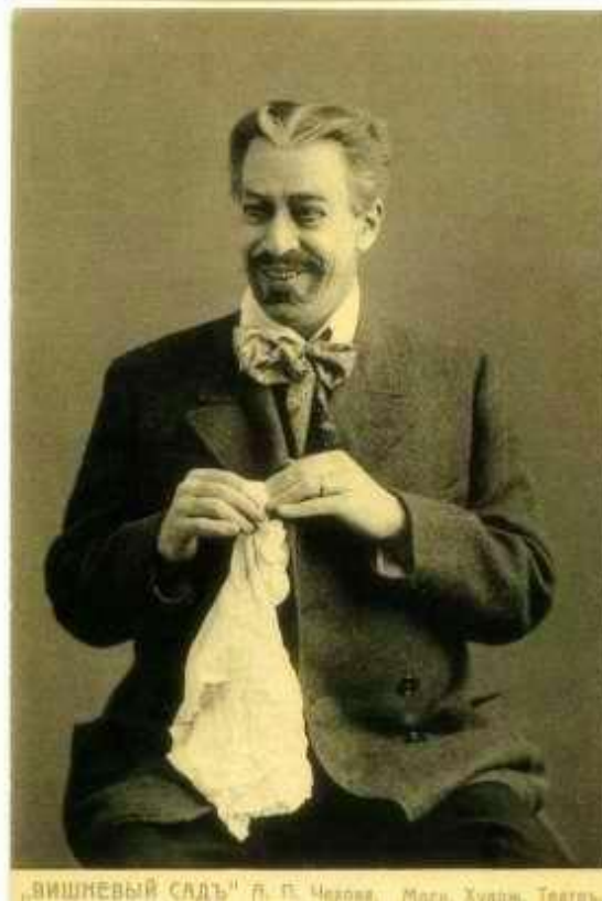
«ВИШНЕВЫЙ САДЪ» Л. П. Чехова. Моск. Худож. Театр.