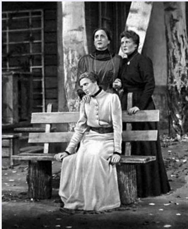
Сцена из спектакля «Три сестры» А. П. Чехова. 1940. Режиссёр Вл. И. Немирович-Данченко.