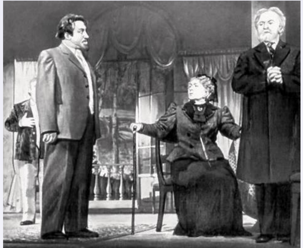
А. П. Чехов. «Дядя Ваня». Сцена из спектакля. 1958.