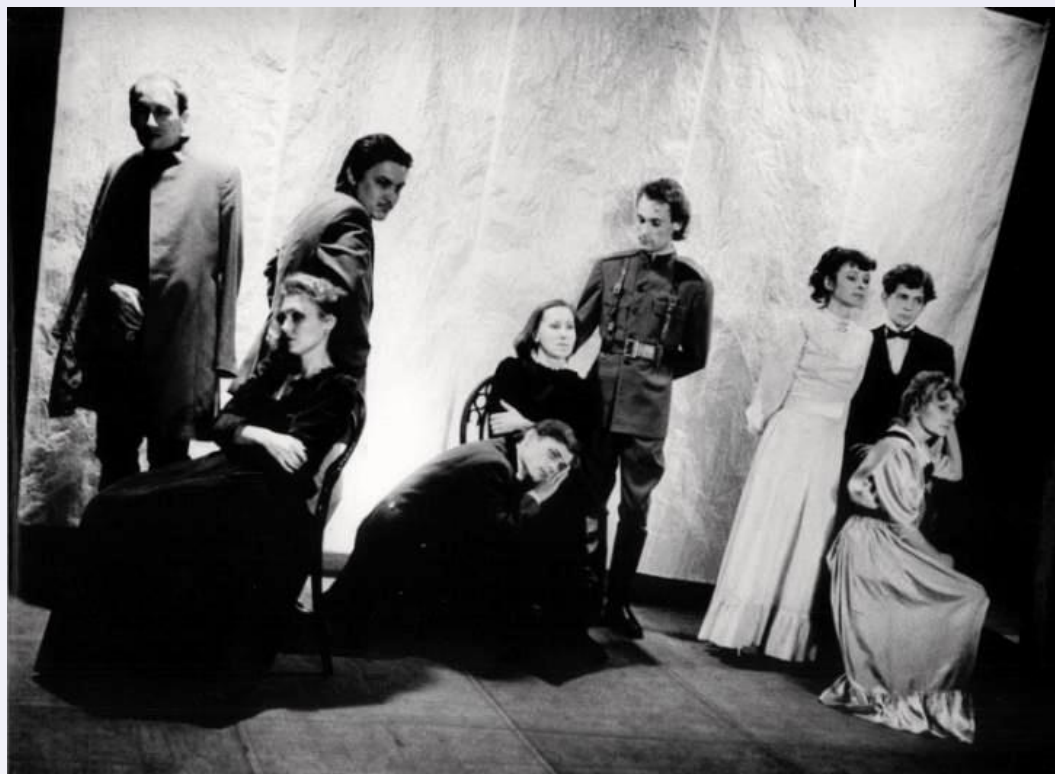
Сцена из спектакля «Три сестры» А. П. Чехова. Молодёжный театр. 1993.