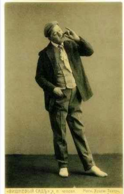
«ВИШНЕВЫЙ САДЪ» Л. П. Чехова. Моск. Худож. Театр.

«Вишнёвый сад», Московский Художественный театр, 1904 год