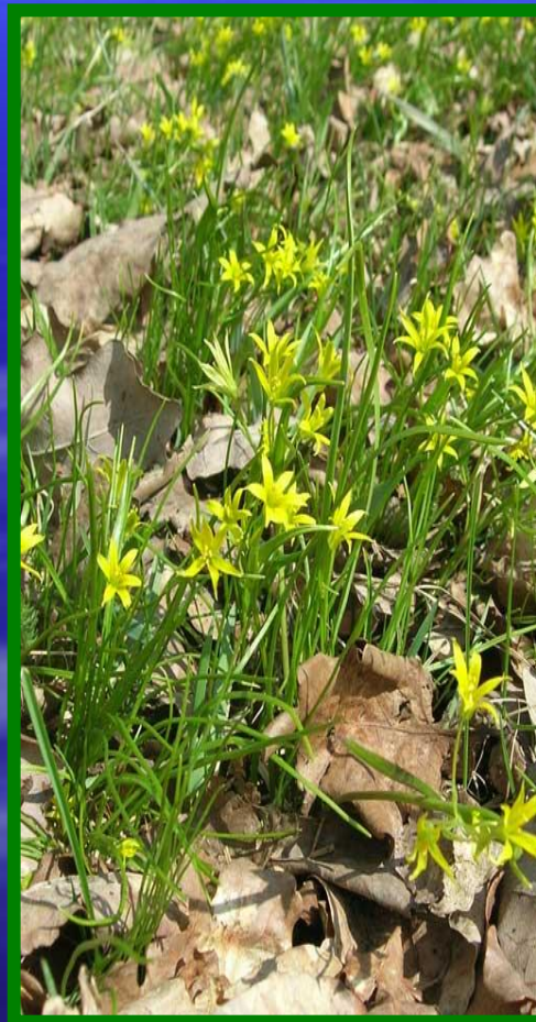
Гусиный лук обыкновенный