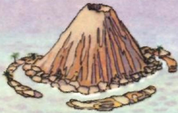
Коралловый береговой риф вокруг вулкана