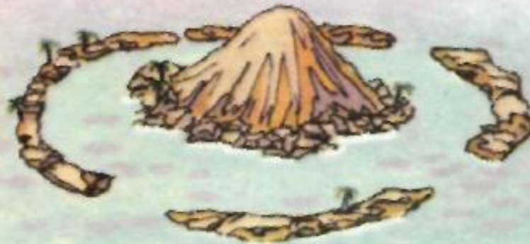
Барьерный риф вокруг разрушающегося вулкана