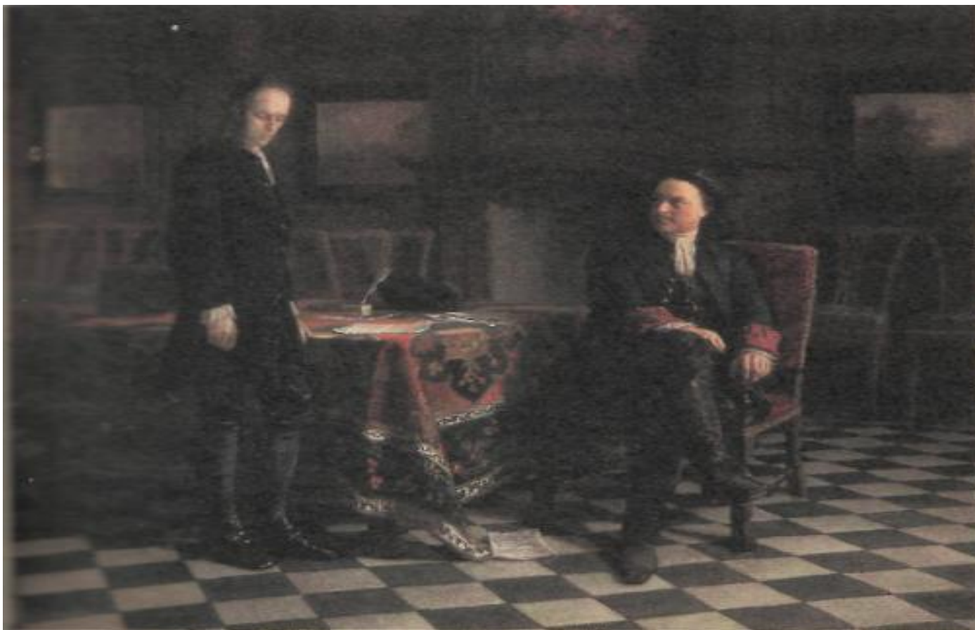
«Петр I допрашивает царевича Алексея», Н.Н. Ге