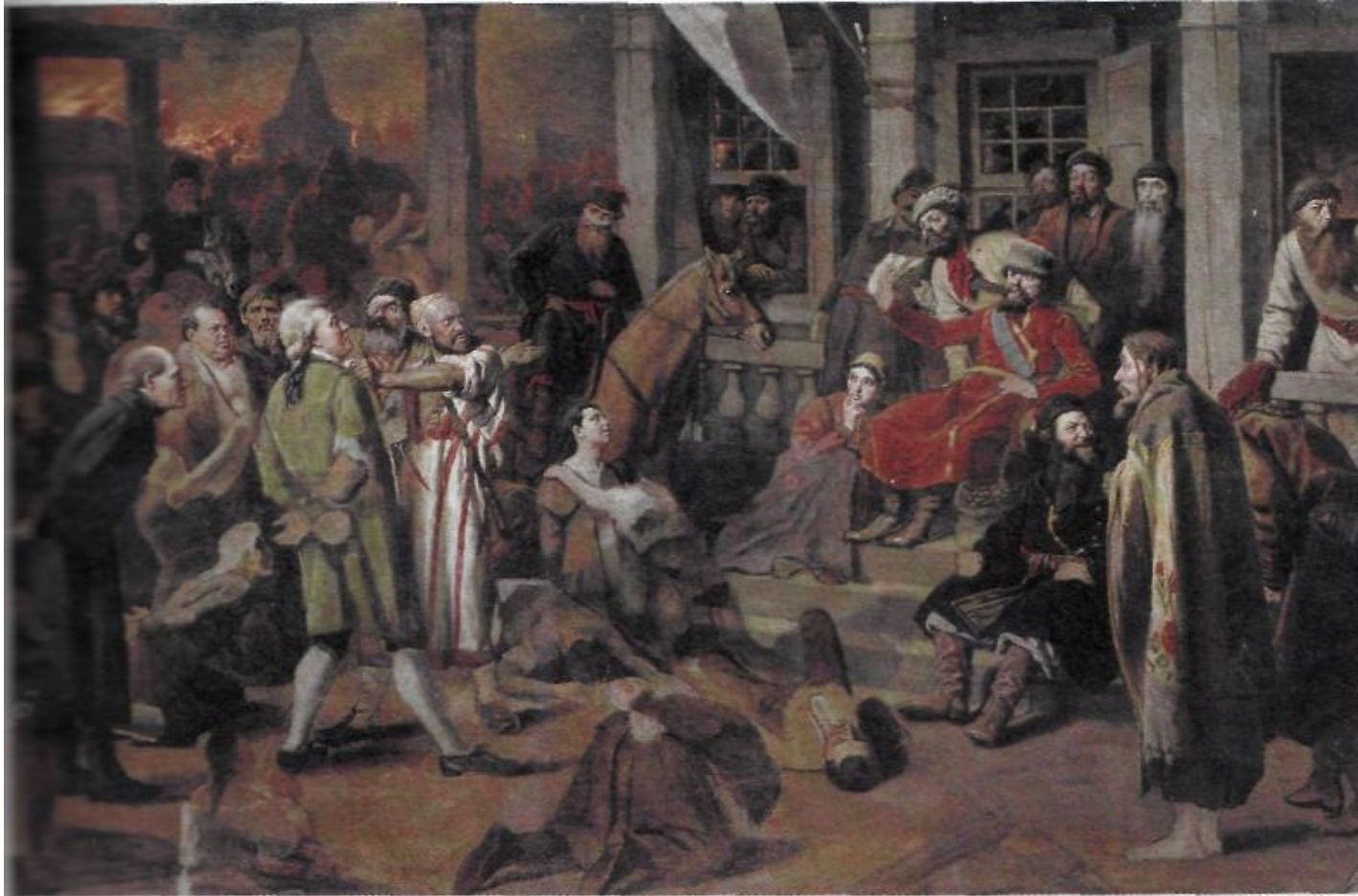
«Суд Пугачева», В. Г. Перов