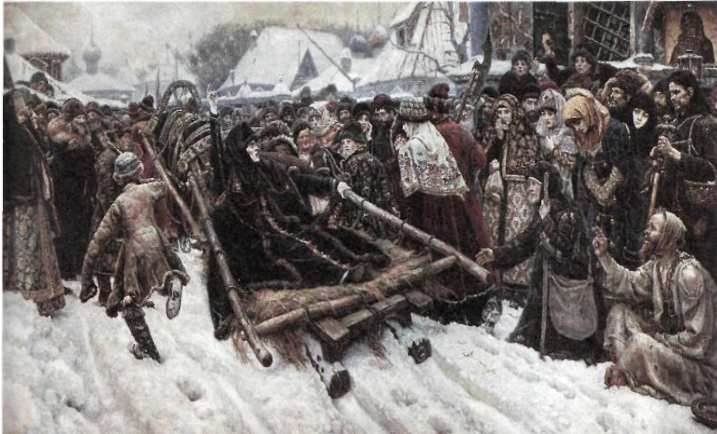
« Боярыня Морозова », В.И. Суриков