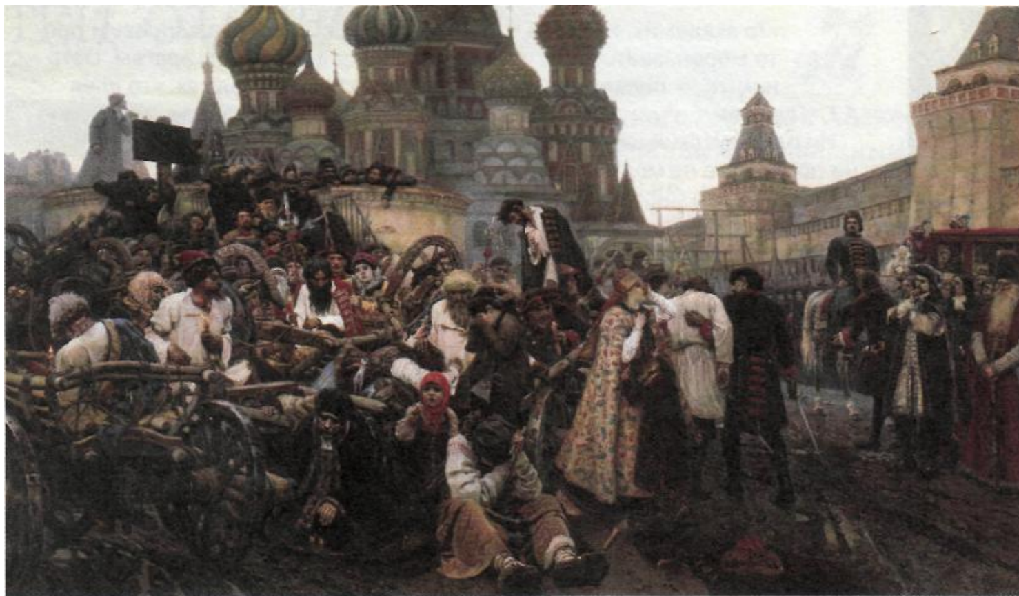
«Утро стрелецкой казни», В.И. Суриков