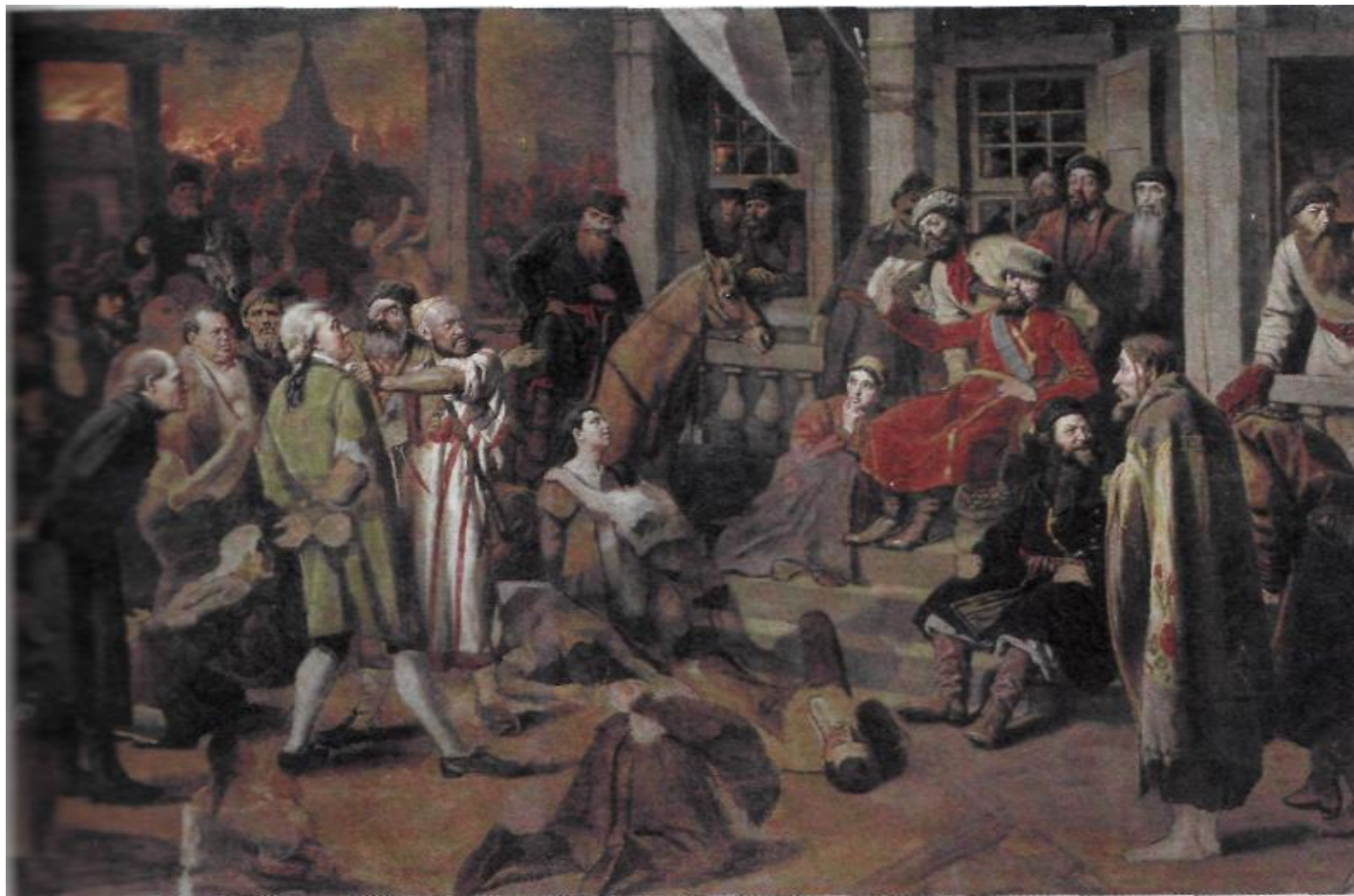
«Суд Пугачева», В. Г. Перов