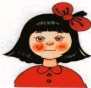
Рис. 3. Равнодушие