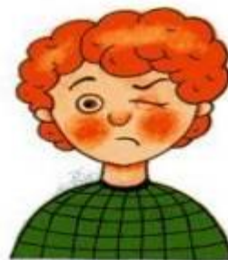
Рис. 5. Досада