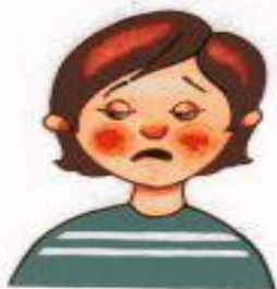
Рис. 1. Обида

Задание 34. Посмотрите внимательно на рисунки. На них нарисованы ученики с разными эмоциями. Постарайтесь определить, в каком случае могли возникнуть те или другие эмоции. Для этого в тетради выпишите номера рисунков и напротив каждого из них поставьте номер ситуации.