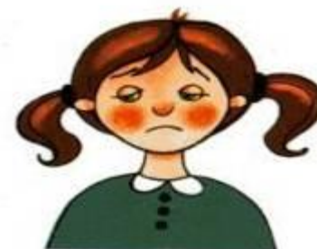
Рис. 6. Печаль