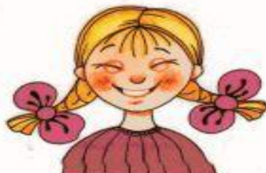
Рис. 4. Радость