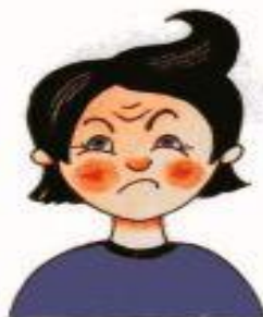
Рис. 2. Злость