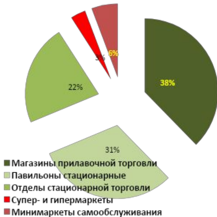
Соотношение торговых объектов в Москве