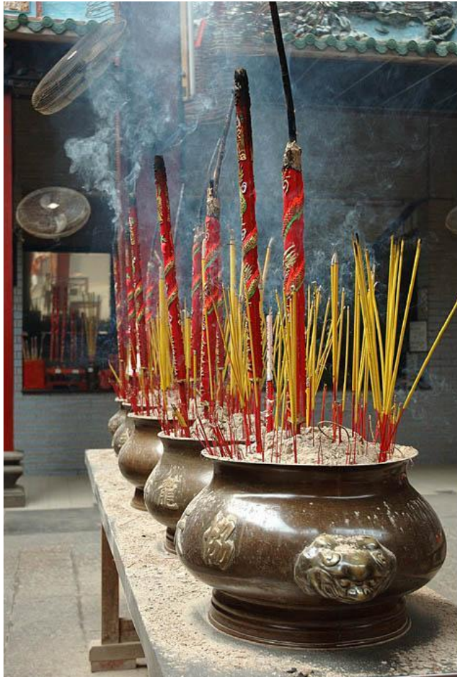
В Буддийском храме

Правильная вера, правильные ценности, правильная речь, правильное поведение, правильное достижение средств к жизни, правильные стремления, правильная оценка своих действий и восприятие мира органами чувств, правильная медитация (концентрация внимания на внутреннем состоянии сознания).