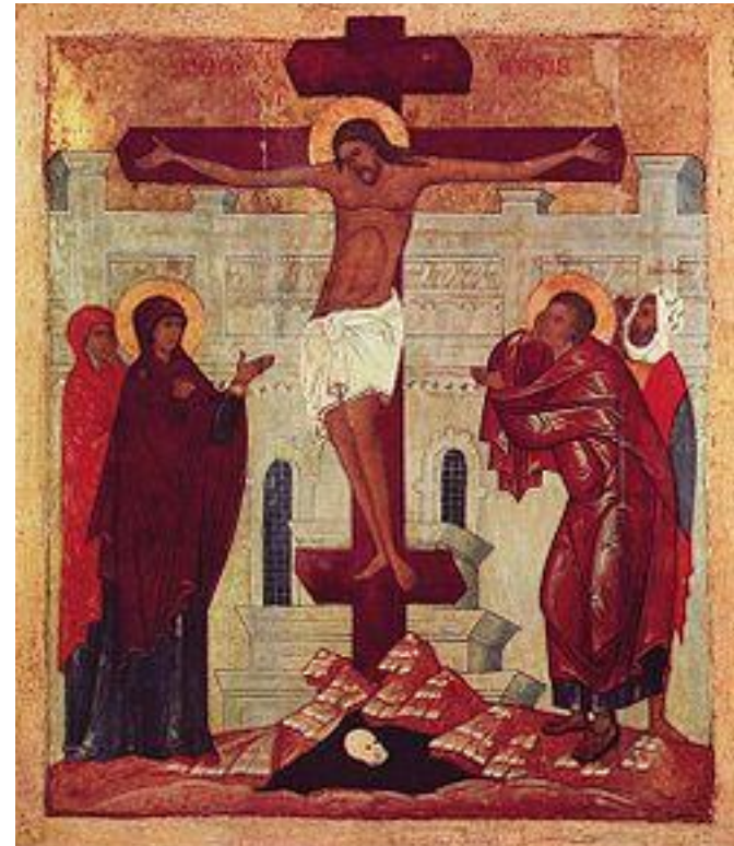
Икона «Распятие с предстоящими»