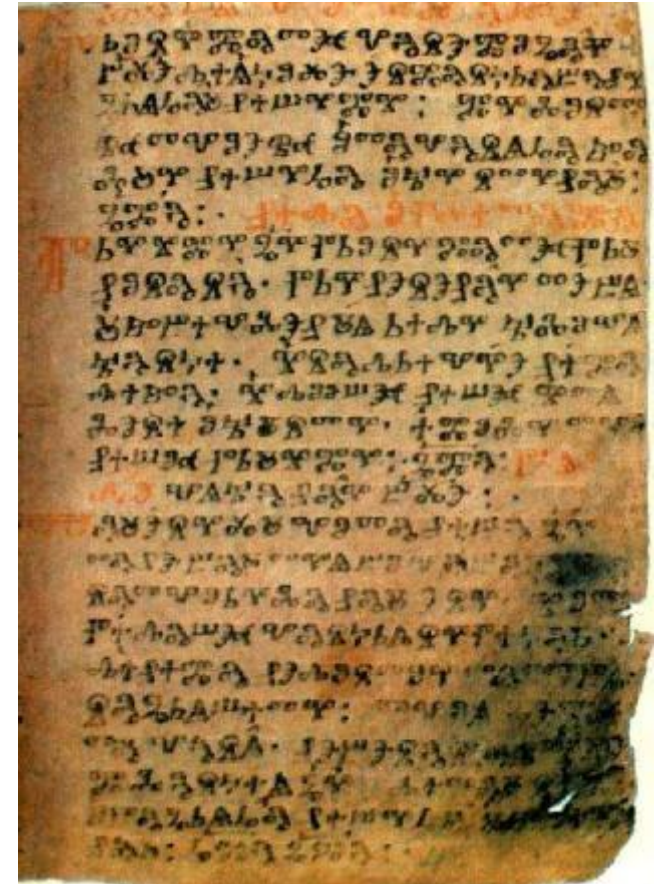
Тора – священная книга