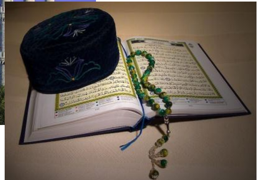
Коран – священная книга