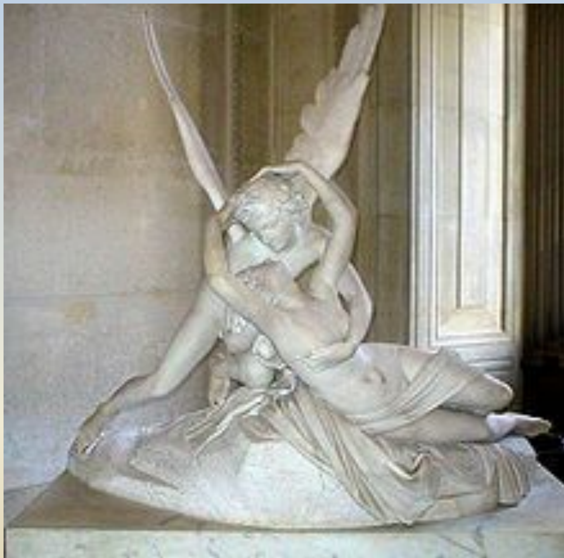
Антонио Канова «Амур и (?)»