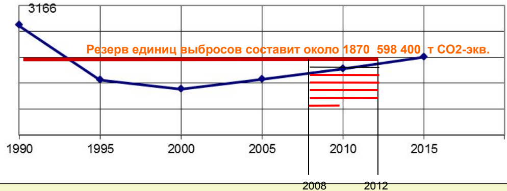
Динамика выбросов парниковых газов за 1990-2015 гг. (факт и прогноз), млн.т CO 2 -эквивалента

Количественные: выбросы парниковых газов в Украине в период 2008-2012 гг. не должны превышать уровень выбросов 1990 года.