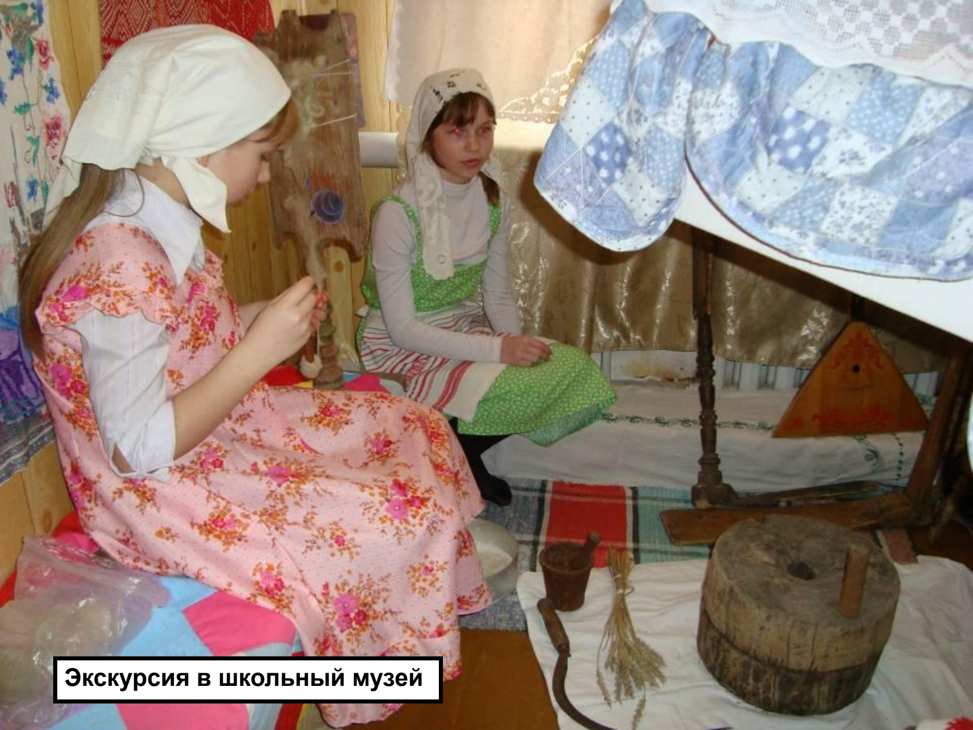
Экскурсия в школьный музей