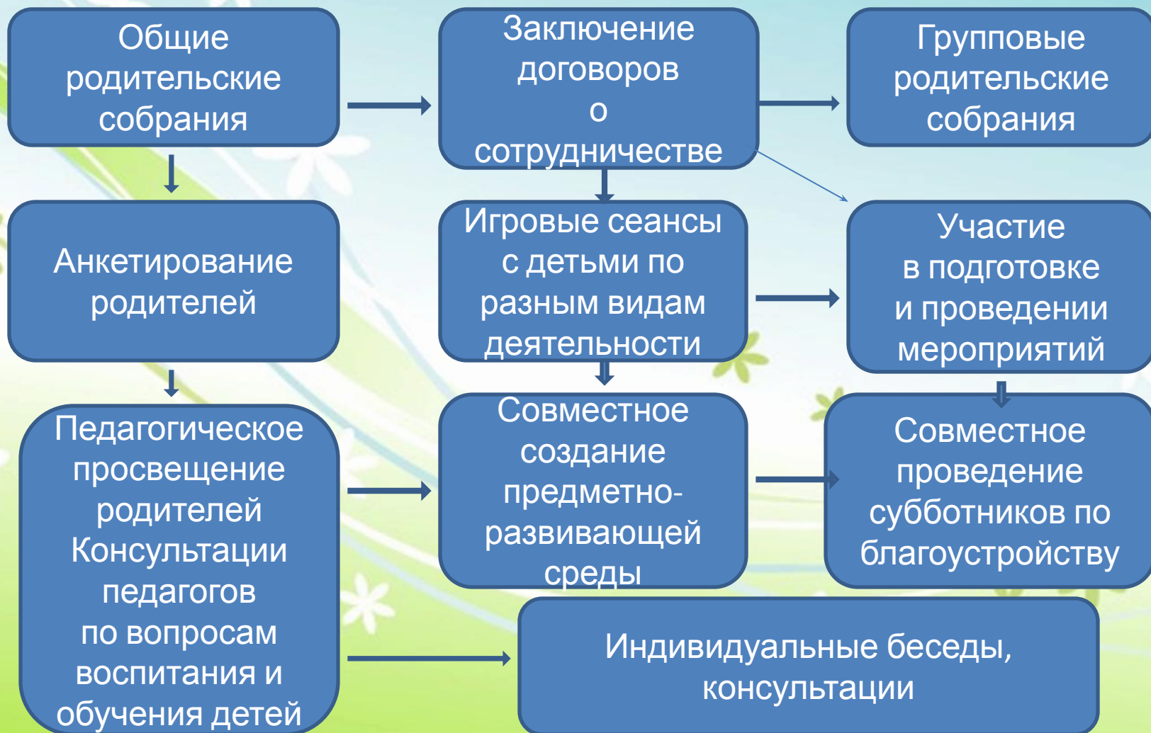
Схема взаимодействия с родителями в условиях работы ЦИПР