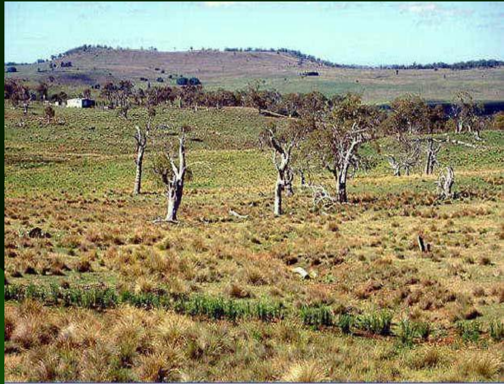
Полупустынный ландшафт центральных районов Австралии.