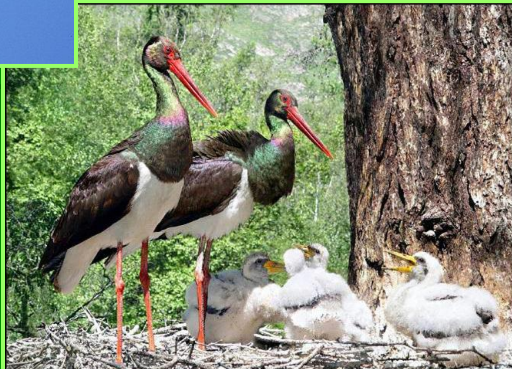
Аисты чёрные ( Ciconia nigra ), пара с птенцами в гнезде