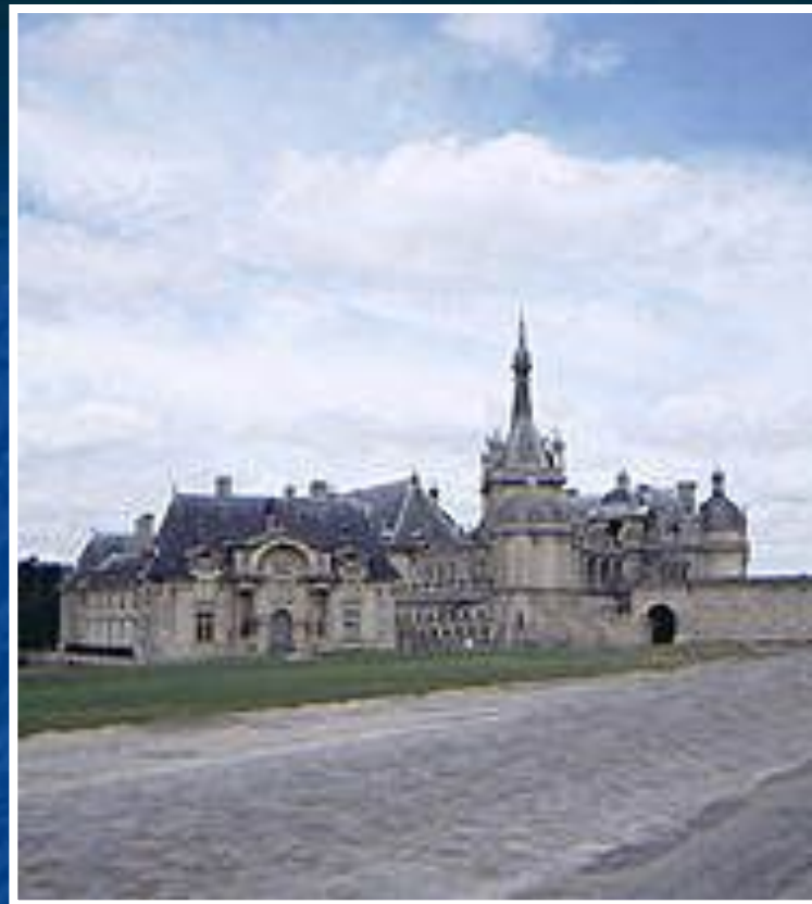
Замок Шантийи около Парижа.