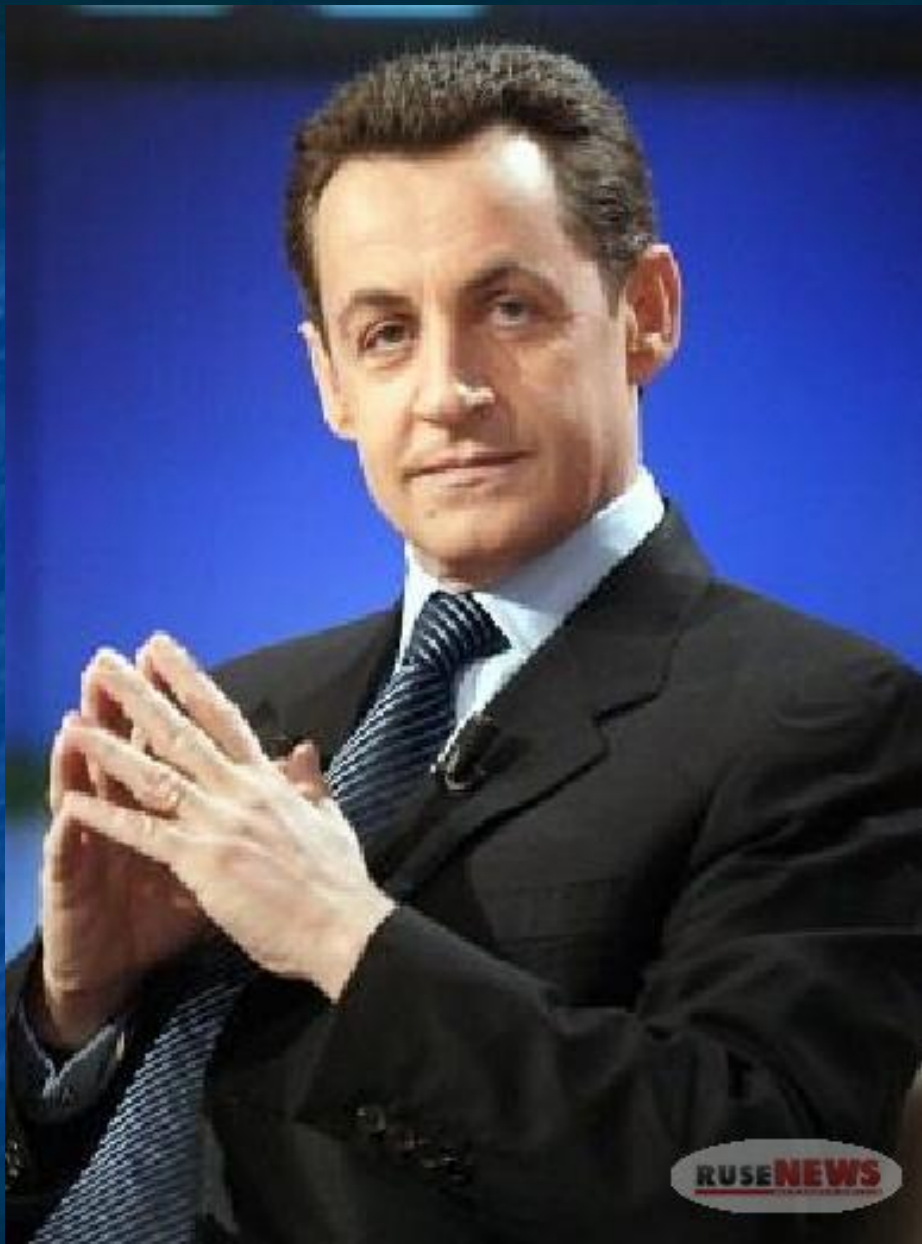
Президент Франции Николя Саркози.