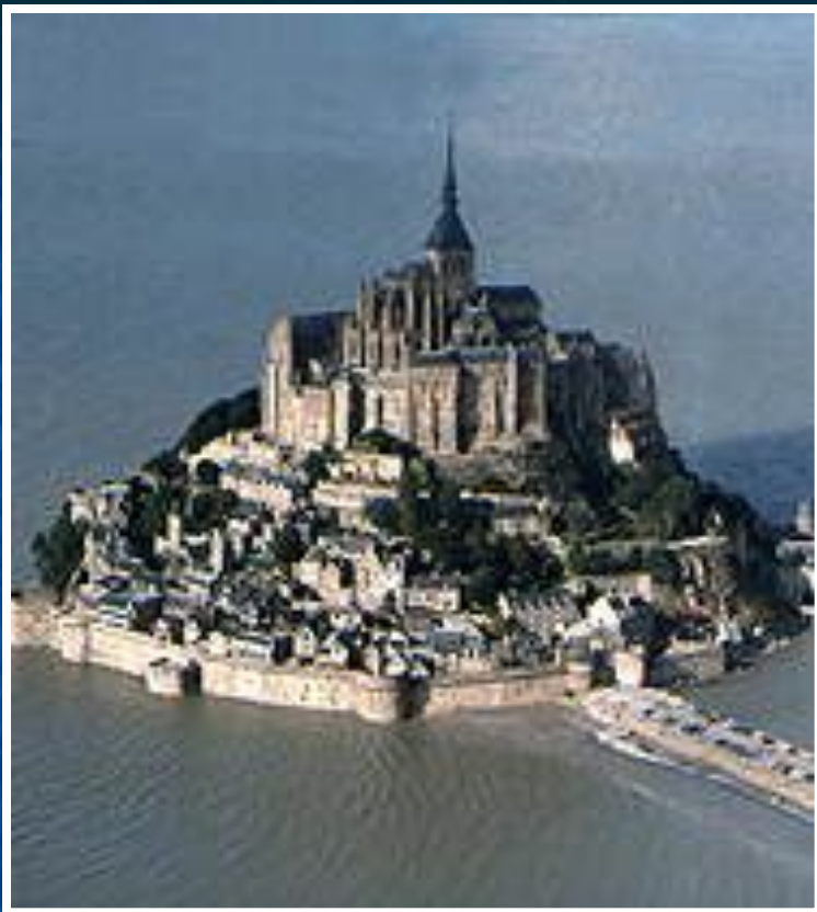
Замок Мон-Сен-Мишель на границе Бретани и Нормандии.