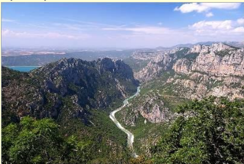
The Verdon's Gorges