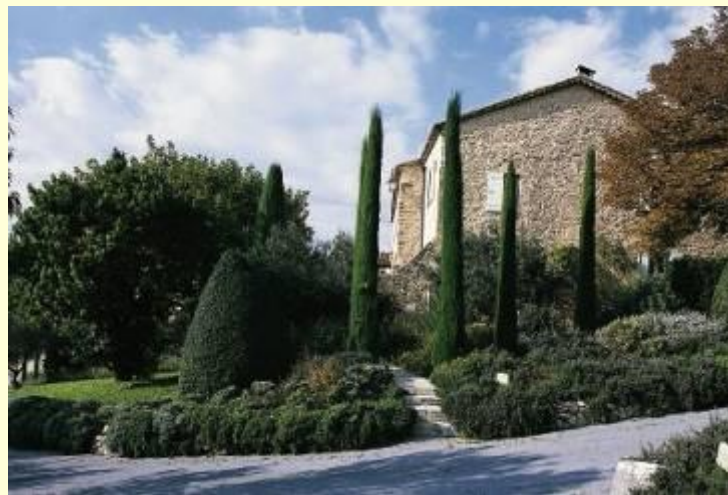
“Bastide de Moustiers”