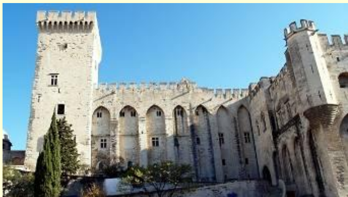
Папский дворец в Авиньоне