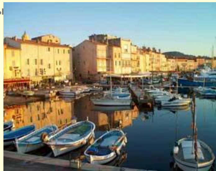
Залив Saint Tropez