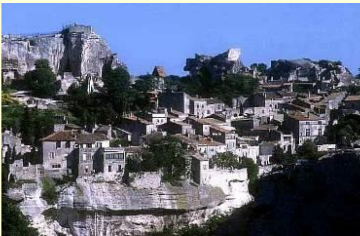
Les Baux de Provence

Поездка в « Les Baux de Provence » и посещение фермы по изготовлению оливкового масла , затем переезд и экскурсия с гидом по Les Baux village и свободное время для прогулки по маленьким улицам – фантастические виды гор и пейзажи заповедника Camargue! Ланч, затем поездка по живописной дороге до Gordes, одного из самых красивых городков Франции (с остановкой) – Ужин и ночлег.