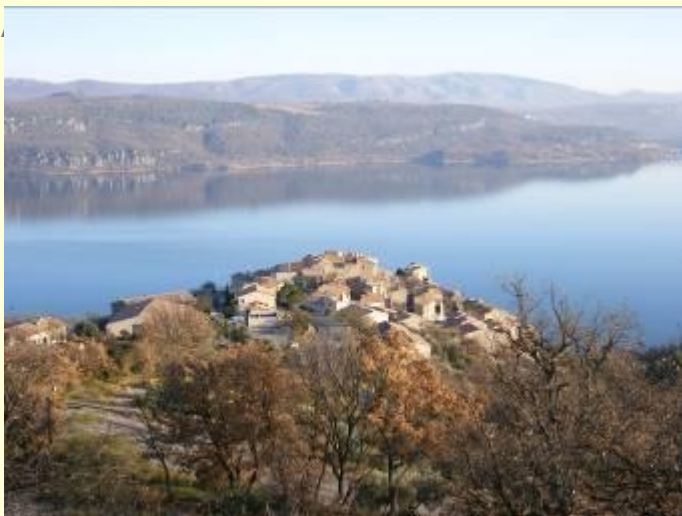
Озеро Sainte Croix

Сегодня для вас эпикурейский банкет ! Прекрасная дорога, которая принесёт вас к Haute Provence, между Lure и горами Luberon. Вы откроете известный напиток “Pastis” с традиционным обедом в Forcalquier. Окруженная великолепными пейзажами, дорога принесёт вас к озеру Sainte Croix, затем к Moustiers Sainte Marie, хорошо известному за его посуду по всему миру – Затем будет ужин в ресторане известного повара