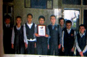
Фото: Награждение учащихся гимназии №12