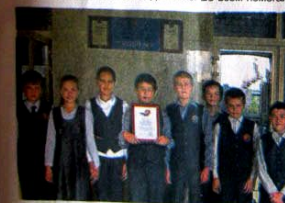
Фото: Награждение учащихся гимназии №12