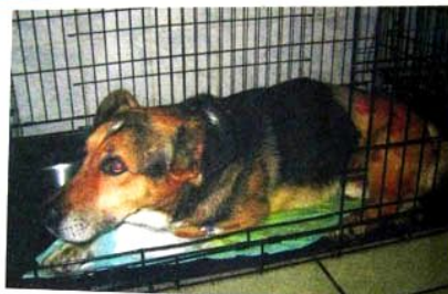
Фото: Найдём после операции

23 июля во дворе дома по улице Станиславского водитель маршрутного такси сбил собаку. Человек не остановился, более того, неторопливо проехал ещё и по передним ламам... Очевидцы оттащили собаку с дороги и обратились в наш Фонд за помощью. Но к сожалению, никому не пришло в голову записать номер машины. Отчего так? Самые привычные наши мысли - «все равно ему за это ничего не будет или ну, это всего лишь бездомная собака...»? Таким образом, мы считаем зло неизбежным? Нам ли менять в своем созна-