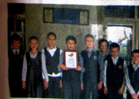
Фото: Награждение учащихся гимназии №12