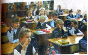
Фото: «Уроки добра» СОШ №12

С началом нового учебного года вновь стартовал один из самых успешных проектов нашего Фонда - «Уроки добра».