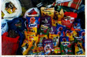
Фото: Подарки для питомцев горьковского приюта