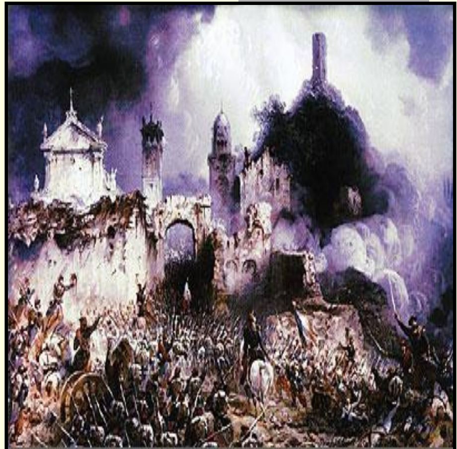
«Битва при Сольферино»