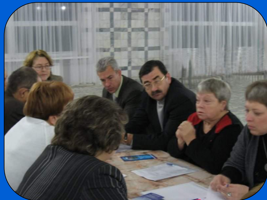
Заседание Попечительского совета фонда с участием Министерства социального развития Саратовской области и Администрации Фрунзенского района