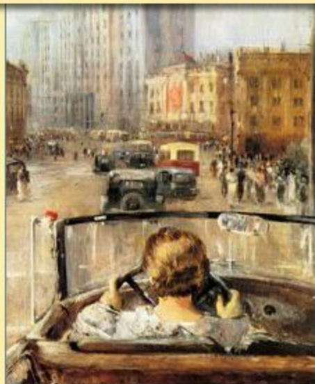
Ю. Пименов Новая Москва 1937 г.

В живописи 30-х годов наряду с художниками, посвятившими свое творчество в основном революционно-героической и советской патриотической тематике, такими как Б. В. Йогансон, С. В. Герасимов, И. И. Бродский, А. А. Дейнека, плодотворно работали в жанре портрета, пейзажа и натюрморта П. П. Кончаловский и И. Э. Грабарь.