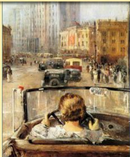
Ю. Пименов Новая Москва 1937 г.

В живописи 30-х годов наряду с художниками, посвятившими свое творчество в основном революционно-героической и советской патриотической тематике, такими как Б. В. Йогансон, С. В. Герасимов, И. И. Бродский, А. А. Дейнека, плодотворно работали в жанре портрета, пейзажа и натюрморта П. П. Кончаловский и И. Э. Грабарь.