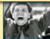
«Путевка в жизнь»

В советской кинематографии в 30-е годы утвердились нормы социалистического реализма. В русле этого официального «художественного метода» созданы фильмы «Ленин в Октябре», «Ленин в 1918 году» М. И. Ромма, «Человек с ружьем» С. И. Юткевича, «Депутат Балтики» А. Г. Зархи и И. Е. Хейфица.