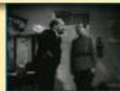
«Ленин в Октябре»