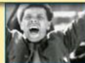
«Путевка в жизнь»

В советской кинематографии в 30-е годы утвердились нормы социалистического реализма. В русле этого официального «художественного метода» созданы фильмы «Ленин в Октябре», «Ленин в 1918 году» М. И. Ромма, «Человек с ружьем» С. И. Юткевича, «Депутат Балтики» А. Г. Зархи и И. Е. Хейфица.