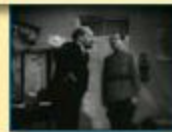
«Ленин в Октябре»