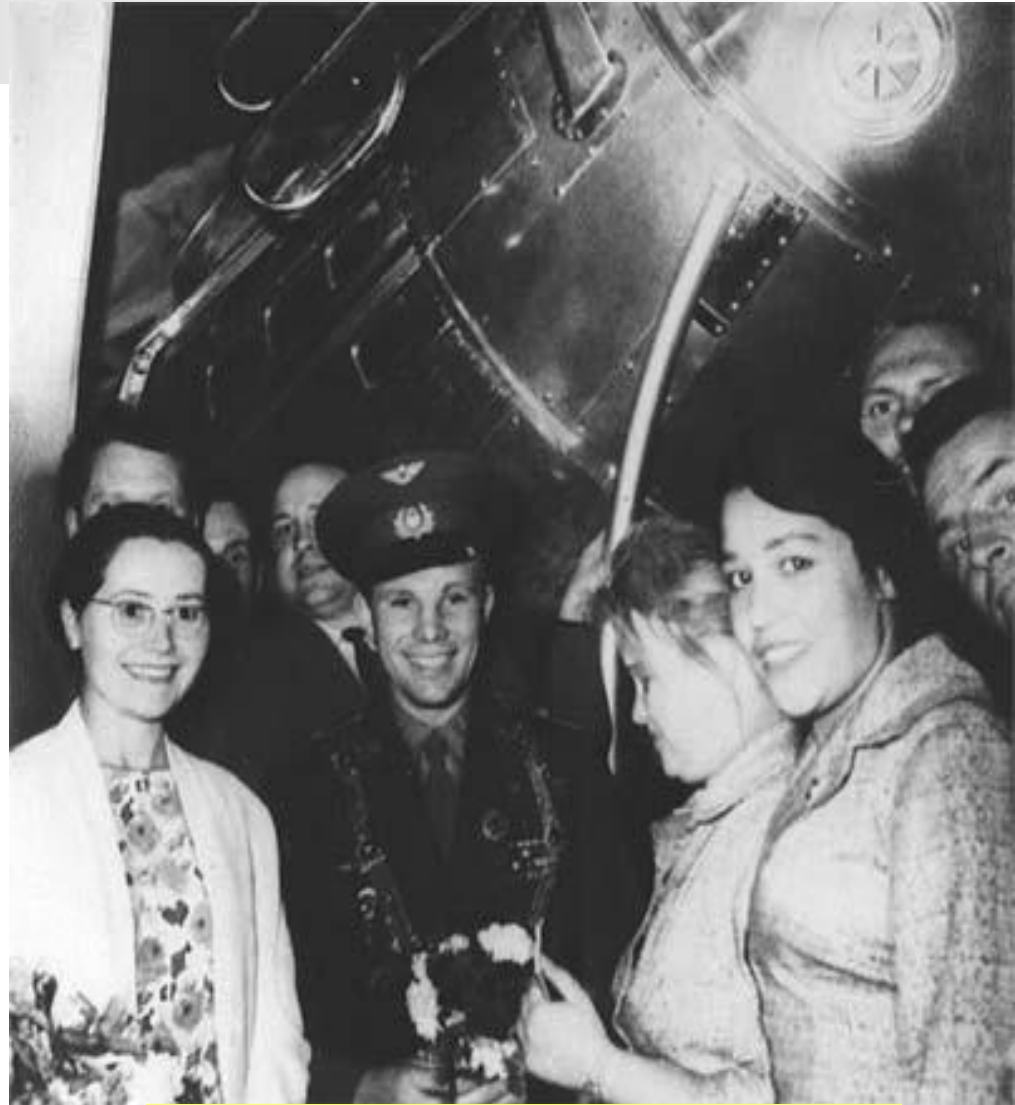
Гагарин из одной зарубежной поездки

Уже в конце апреля Юрий Гагарин отправился в свою первую зарубежную поездку. «Миссия мира», так называют поездку первого космонавта. Она продолжалась 2 года. Встретиться с ним считали за честь короли и президенты, ученые, писатели и другие. Вовремя этих поездок Юрий Алексеевич получил коллекцию наград.