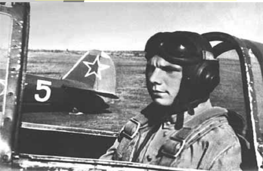
В кабине самолета