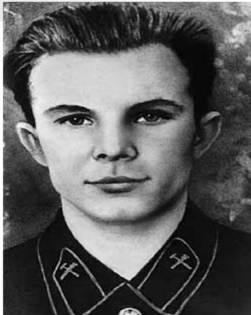
Гагарин-студент индустриального техникума

30 сентября поступил в Люберцкое ремесленное училище №10. Одновременно с учебой в училище, поступил в Люберецкую вечернюю школу рабочей молодежи. Спустя месяц с отличием окончил ремесленное училище по специальности формовщик-литейщик. Своей рабочей профессией Юрий Алексеевич гордился всю жизнь. Окончив училище и получив специальность, Гагарин решает продолжить учебу и уже в августе 1951 г. Становится студентом Саратовского индустриального техникума.