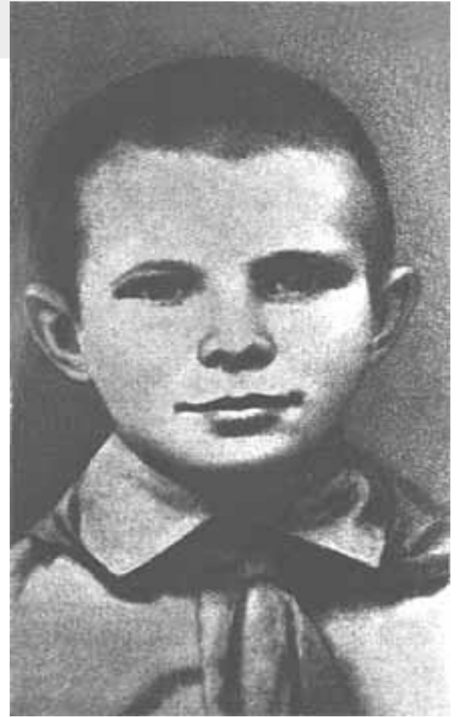
Пионер Юра Гагарин