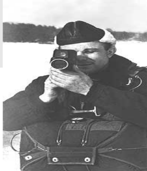
Перед парашютн ым прыжком