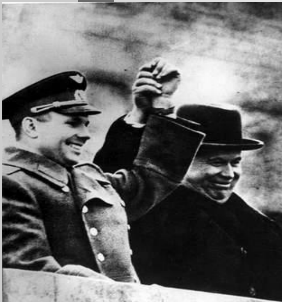
Гагарин и Хрущев на трибуне Мавзолея

За четыре месяца до полета практически всем стало ясно, что полетит Гагарин. Последнее слово оказалось за Никитой Сергеевичем Хрущевым, бывшим в ту пору первым секретарем ЦК КПСС. Когда ему принесли фотографии первых космонавтов, он без колебаний выбрал Гагарина.