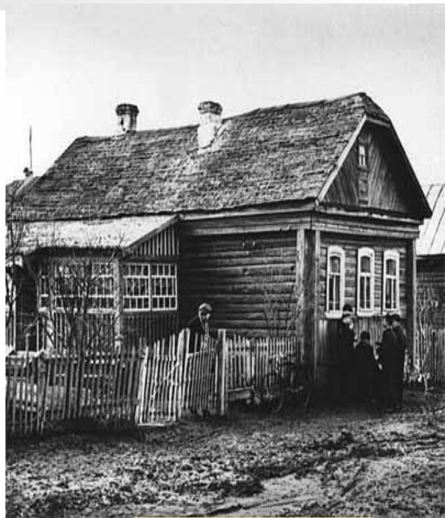
Дом Гагариных в деревне Клушино

Безоблачное детство будущего покорителя космических просторов было прервано начавшейся Великой Отечественной войной. 1 сентября маленький Юрий пошел в первый класс Крушинской неполной средней школой, а уже 12 октября занятия были прерваны – гитлеровские войска оккупировали село. Долгие 2 года пробыли немецко-фашистские войска в Клушино. 1943 г. 9 апреля советские войска освободили село. В 1945 г. Семья Гагариных переехала из Клушино в город Гжатск, где Юрий продолжал свое дальнейшее обучение.