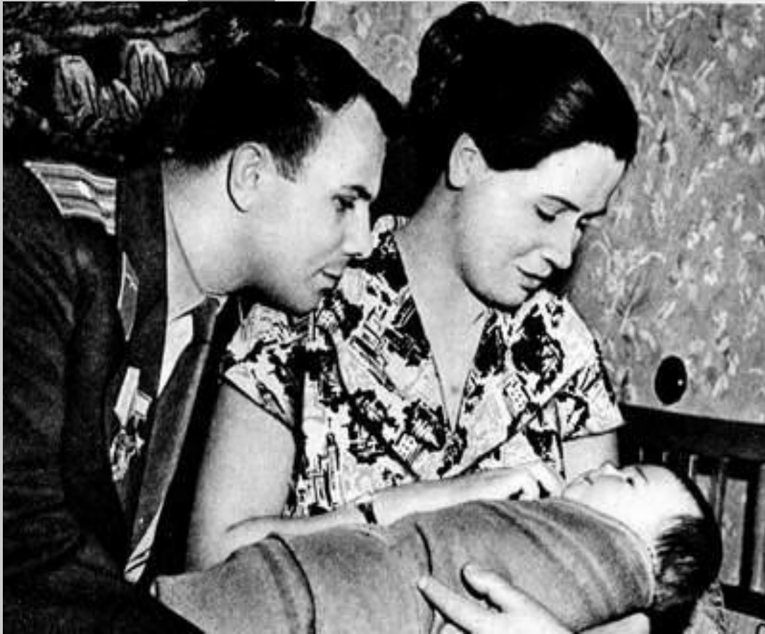
Юрий и Валентина Гагарины с дочерью Галиной

Спустя 2 дня в жизни Гагарина произошло еще одно знаменательное событие - он вступил в брак с Валентиной Ивановной Горячевой. И через год у него родились 2 дочери.