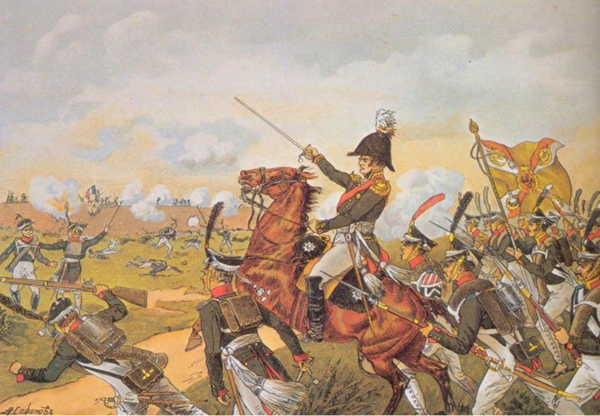
Контратака А. П. Ермолова на захваченную батарею Раевского