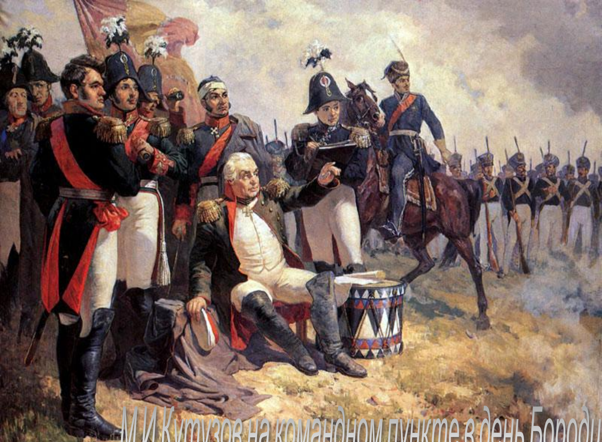
М.И.Кутузов на командном пункте в день Бородин