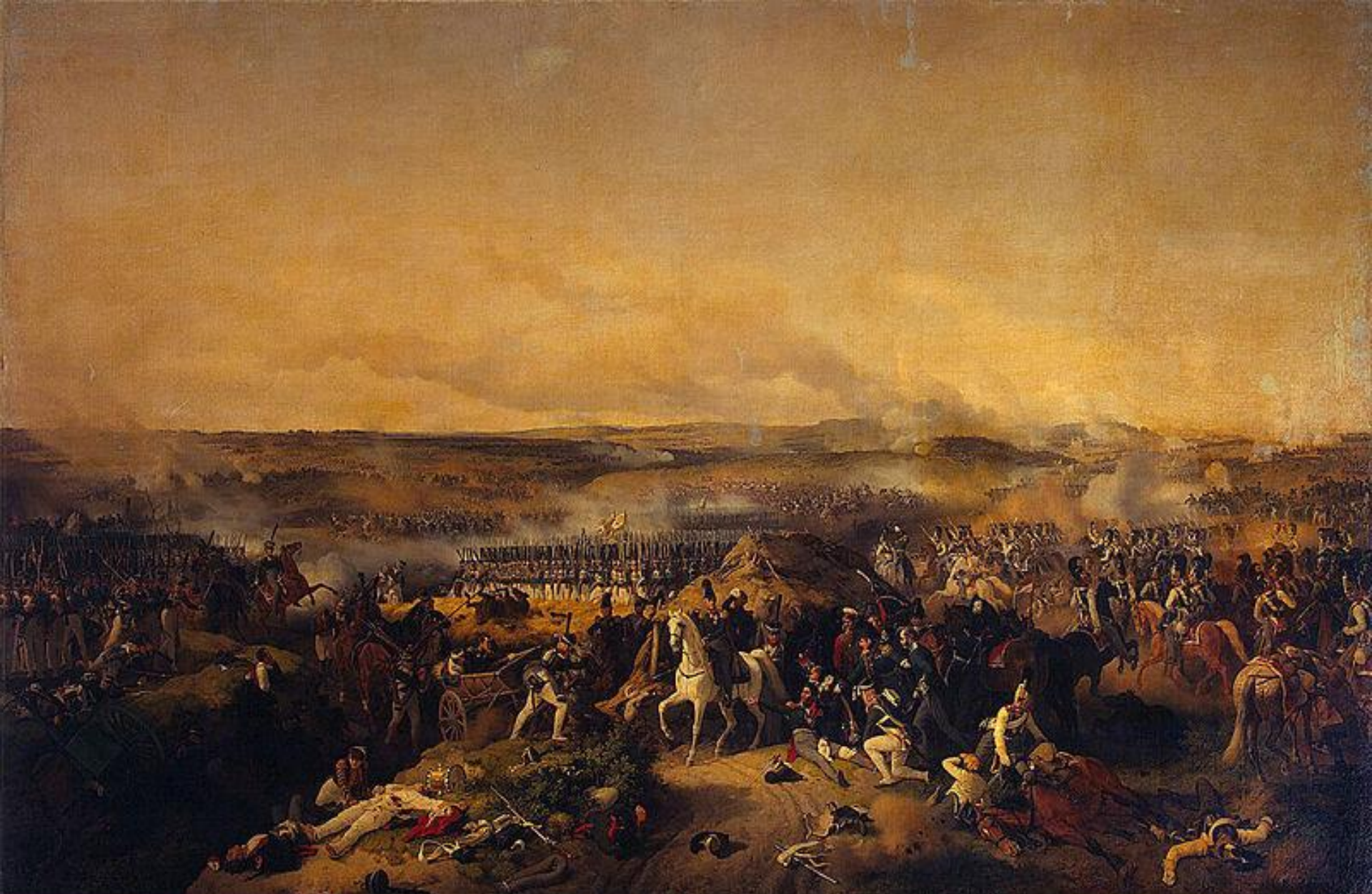
В центре картины раненый П. И. Багратион, рядом с ним на коне П. П. Коновницын. Вдали виднеется каре лейб-гвардии