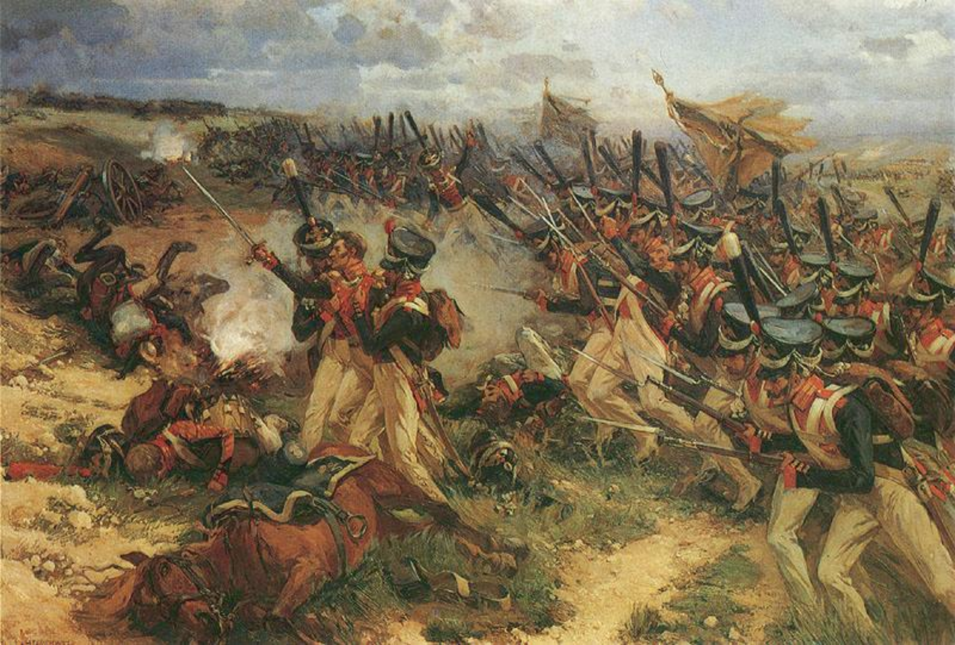
Атака лейб-гвардии Литовского полка из 5-го пехотного корпуса