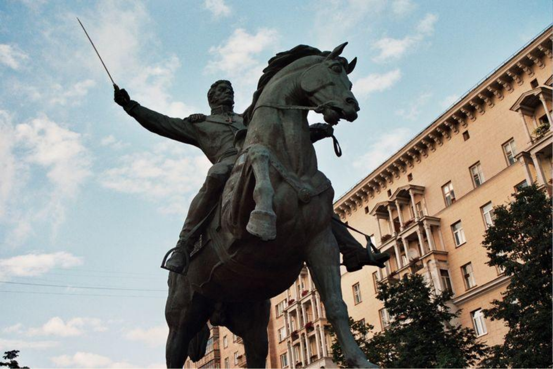
Памятник Багратиону в Мос